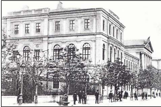
Fig. 3. Universitatea din București – sediu al Muzeului Național de Antichități între 1864 și 1931.