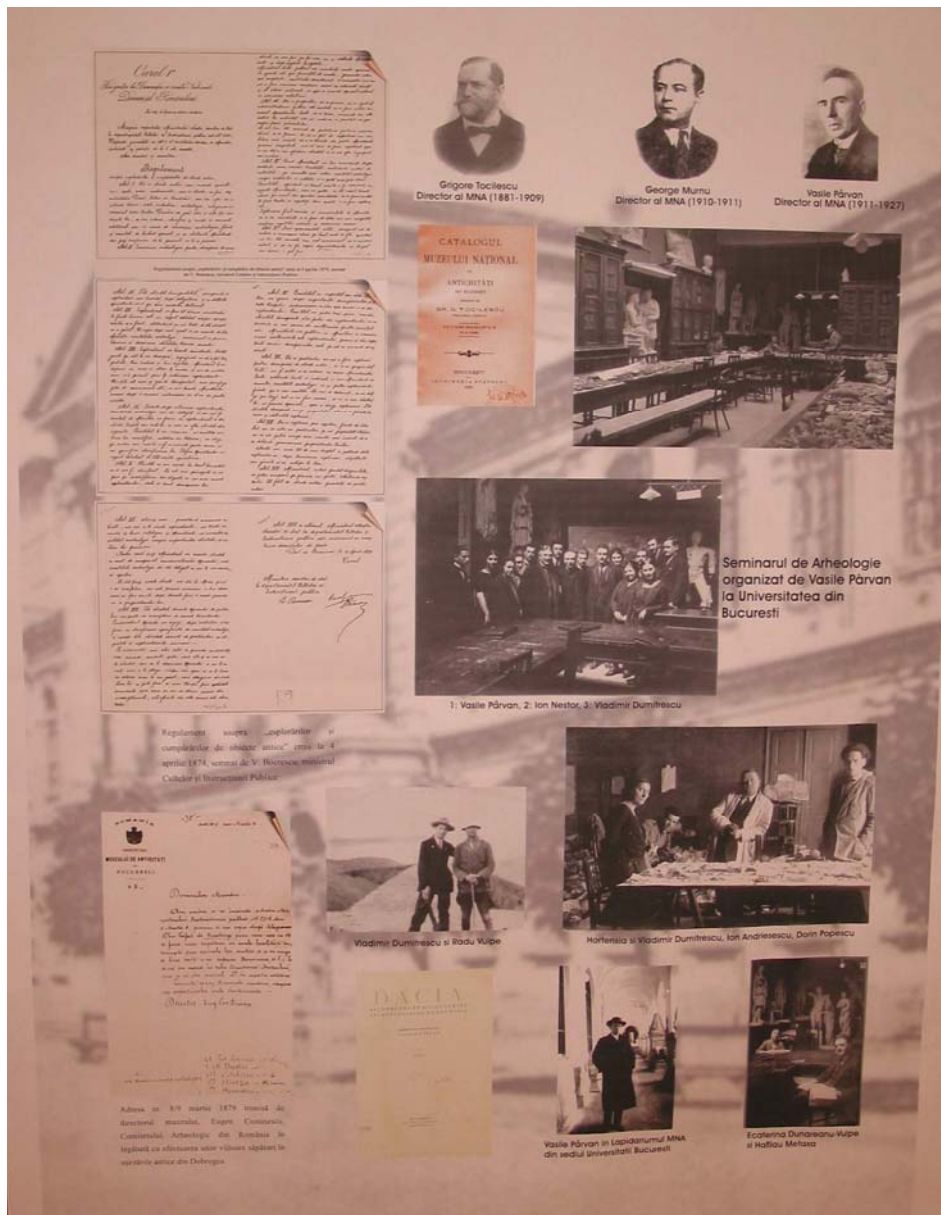
Fig. 5. Poster din expoziția comemorativă de la Biblioteca Academiei Române (nov. 2004–ian. 2005): MNA în perioada 1874–1927.

Epocii Tocilescu (director până la moartea sa în anul 1909) i-a urmat în istoria Muzeului Național de Antichități și în istoria arheologiei românești, între anii 1910 și 1927, epoca Pârvan (fig. 5). Sub conducerea Magistrului , cum îl numeau plini de respect elevii săi, ponderea activității de teren a muzeului, pe de o