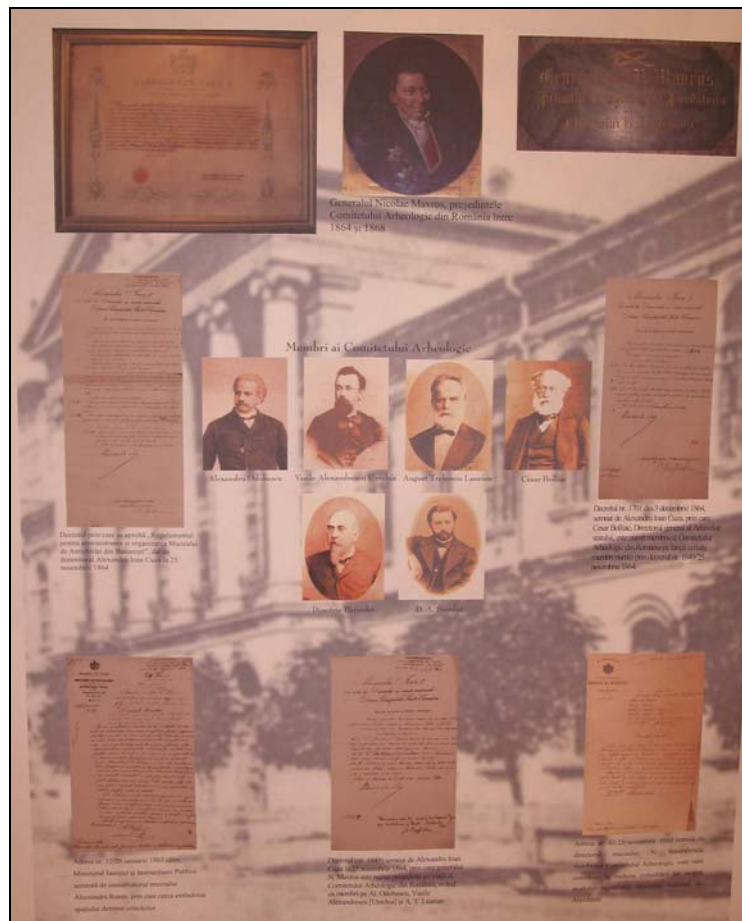
Fig. 4. Poster din expoziția comemorativă de la Biblioteca Academiei Române (nov. 2004–ian. 2005): începuturile MNA, 1862–1868 (prelucrare digitalizată Andrei Măgureanu).