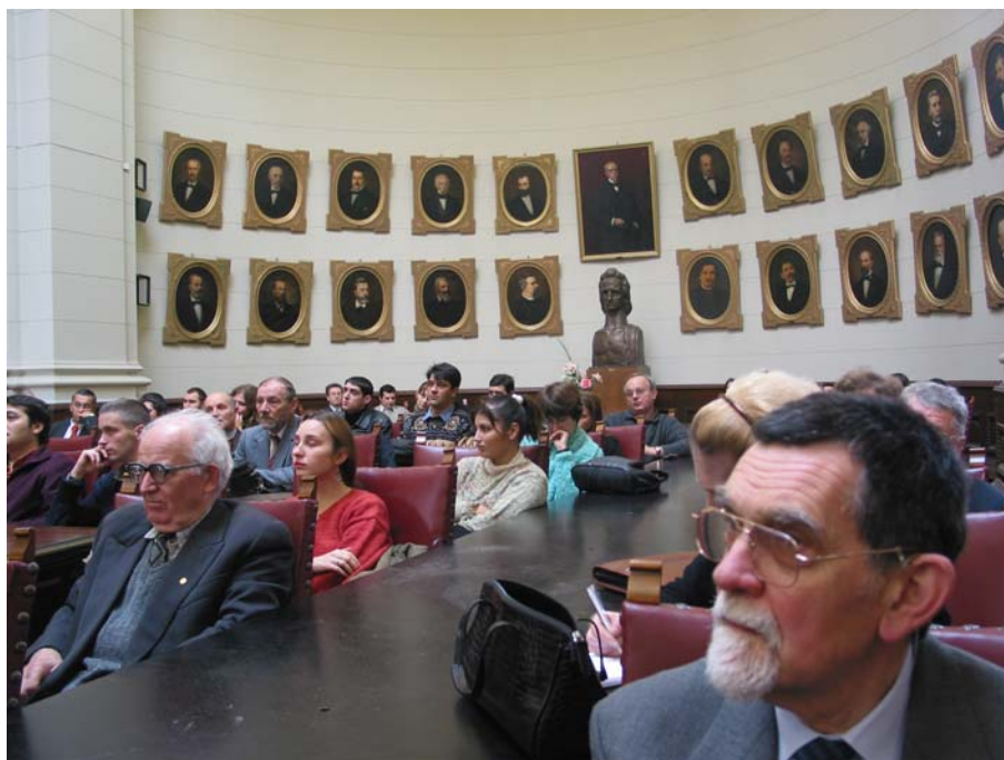
Fig. 7. Institutul de Arheologie „Vasile Pârvan”: 2. Adunarea festivă din 25 noiembrie 2004 în Aula Academiei Române.