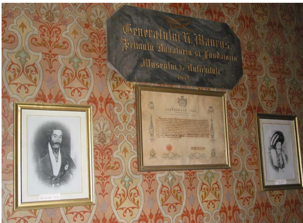
Fig. 6. Institutul de Arheologie „Vasile Pârvan”, 2004: 2. Biroul directorului.