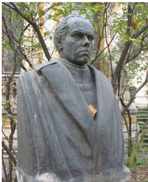
Fig. 7. Institutul de Arheologie „Vasile Pârvan”: 1. Vasile Pârvan (1882–1927).