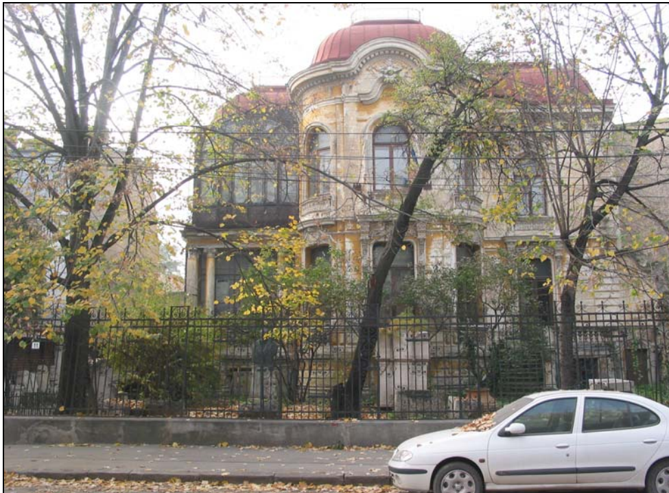
Fig. 6. Institutul de Arheologie „Vasile Pârvan”, 2004: 1. Casa Macca.

În 1931 Muzeul Național de Antichități s-a mutat, cu toate colecțiile sale, din localul Universității în casa Macca, pusă la dispoziție de reputatul istoric Nicolae Iorga, pe atunci prim-ministru. Era pentru prima dată când, după aproape un secol de la înființare, Muzeul dispunea de un local propriu, satisfăcând în bună măsură nevoile de depozitare, prelucrare științifică și muzeistică și expunere a descoperirilor arheologice. În acea casă din actuala stradă Henri Coandă nr. 11, se află și astăzi, ca urmaș al Muzeului, Institutul de Arheologie „Vasile Pârvan” (fig. 6). Pe aceeași linie de continuitate, trebuie arătat că la sfârșitul celui de-al II-lea Război Mondial (1945) schema organizatorică a muzeului prefigura deja în detaliu structura viitorului institut, cu secții de cercetare profilate pe criteriul cultural-cronologic (preistorie, epoca greco-romană, evul mediu), cabinet numismatic, bogată bibliotecă și arhivă științifică, cabinet de desen și cartografie, laborator de restaurare.