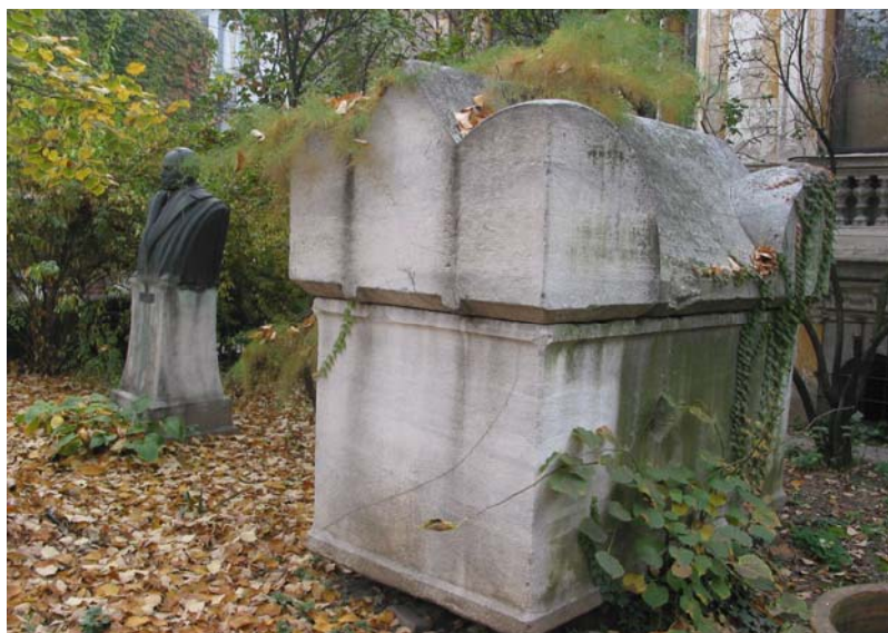
Fig. 6. Institutul de Arheologie „Vasile Pârvan”, 2004: 3. Lapidariul, cu bustul lui Vasile Pârvan.