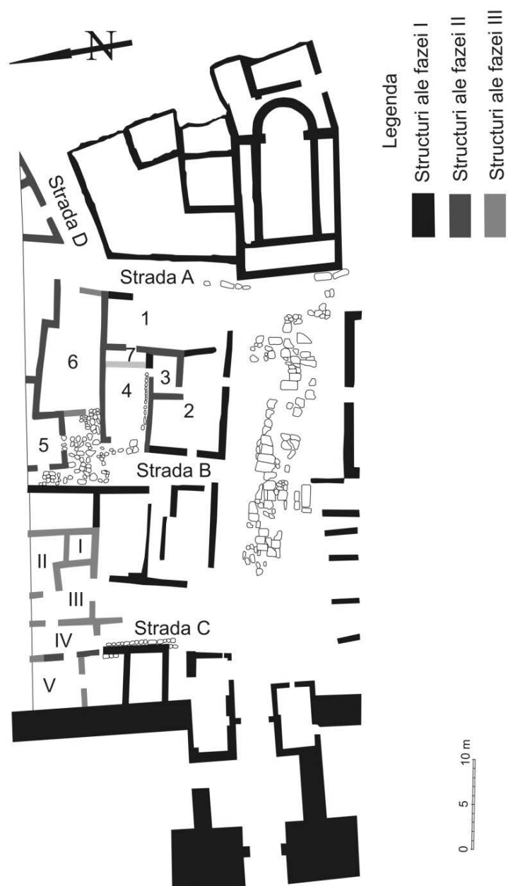
Fig. 4. Cartierul de la nord de Piața Mare, faza III.