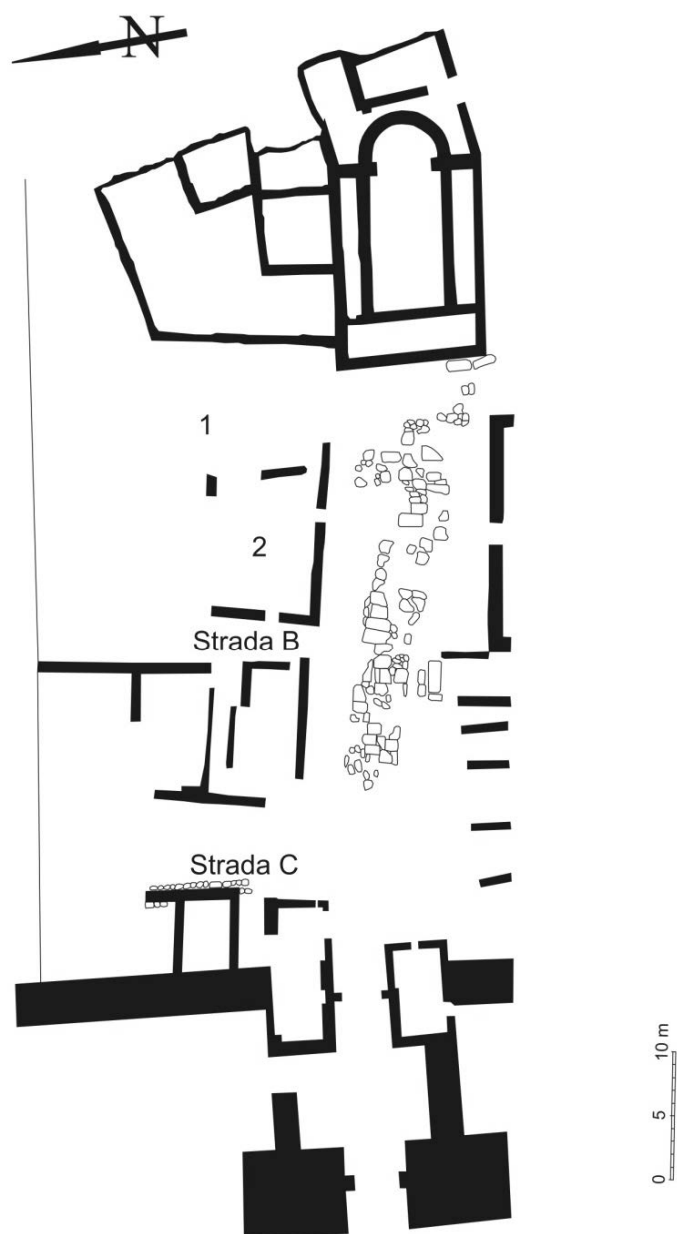
Fig. 2. Cartierul de la nord de Piața Mare, faza I.