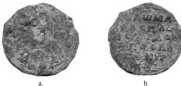
Fig. 1. Sigiliul lui Romanos, protospatharios și strategos , descoperit la Nufăru; a. avers; b. revers.

Personajul era guvernator al unei provincii din Asia Mică (în nordul Turciei de astăzi) și întreținea legături cu provincia de la gurile Dunării. Provincia Paphlagonia a fost reînțemeiată la începutul secolului al IX-lea ca provincie bizantină, fiind situată la vest de provincia Optimaton , învecinată la sud cu provincia Bukellarion , mărginită la est de provincia Armeniakon (fig. 2). Cunoaște o importanță din ce în ce mai mare la începutul secolului al XI-lea, mai ales după ajungerea pe tronul de la Constantinopol a lui Mihail al IV-lea Paphlagonianul, care reușește să refacă prestigiul puterii centrale și să crească importanța acestei provincii 3 . Prin urmare, guvernatorii acestei provincii aveau un rol important în cadrul administrației Imperiului Bizantin.