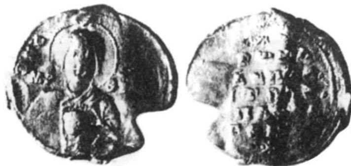
Fig. 3. Sigiliul lui Romanos descoperit la Durostorum–Dristra–Silistra .

Emitentul sigiliului de față poartă numele unui sfânt din secolul al VI-lea (Sfântul Romanos Melodul sau Imnograful – autor de imnuri religioase) 5 .