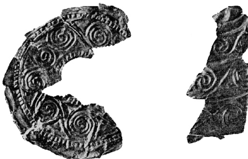
Fig. 5. Discuri ornamentate cu aur descoperite la Țufalău (după Tzigara-Samurcaș 1944).