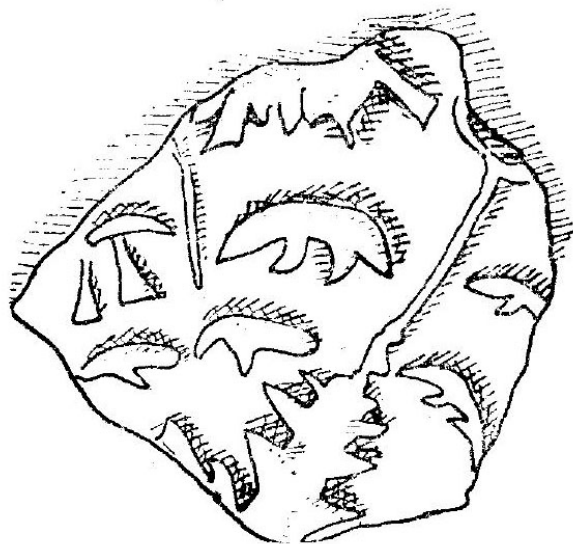
Fig. 4. Fragment ceramic descoperit la Cotnari (după Slătineanu 1938).