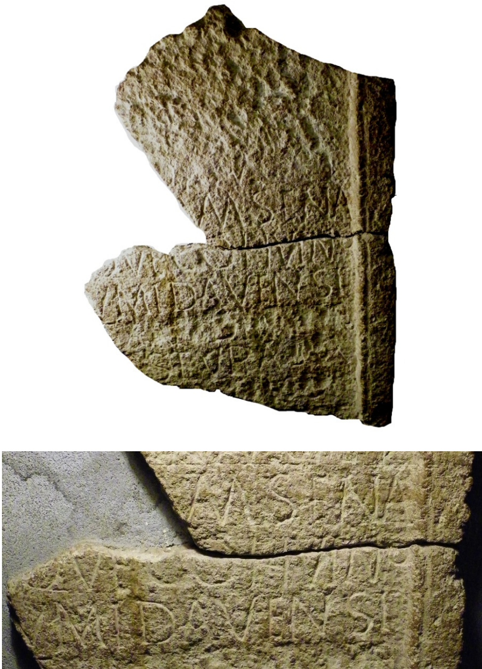
Fig. 3. Inscripția de la Râșnov – Cumidava (foto F. Matei-Popescu, 2014).