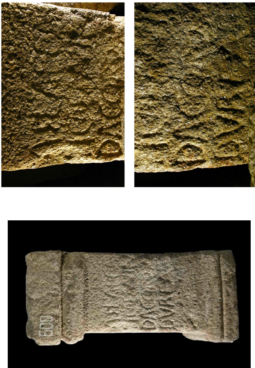
Fig. 5. Inscripția de la Vilar de Areias, Portugalia.