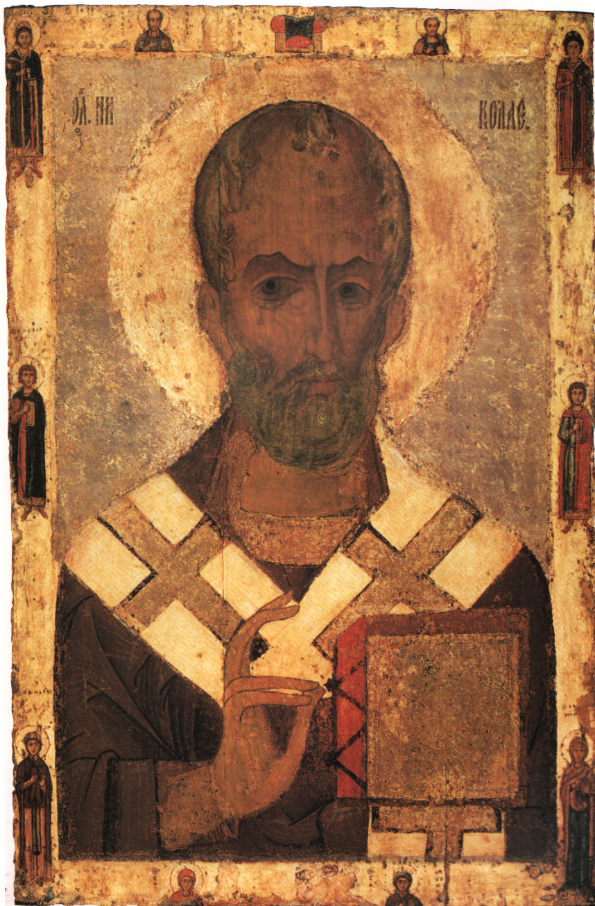
Fig. 6. Icoană din secolul al XII-lea sau de la începutul secolului următor, reprezentând, în plan central, bustul Sfântului Nicolae, flancat de imaginile miniaturizate ale mai multor sfinți (Boris, Gleb etc.), păstrată la Galeria Tretyakov din Moscova.