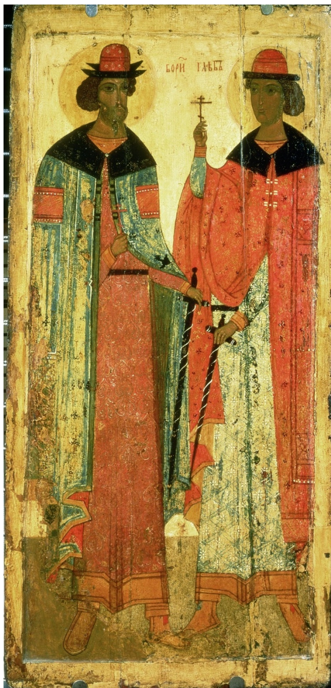
Fig. 4. Sfinții Boris și Gleb, figurați pe o icoană din a doua jumătate a secolului al XV-lea, provenind de la Rostov, păstrată la Galeria Tretyakov din Moscova.