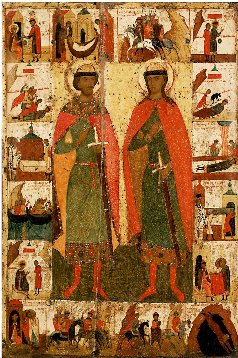
Fig. 5. Sfinții Boris și Gleb, figurați pe o icoană din a doua jumătate a secolului al XV-lea, provenind de la Moscova, păstrată la Galeria Tretyakov din Moscova (foto V. Spinei, 2013).