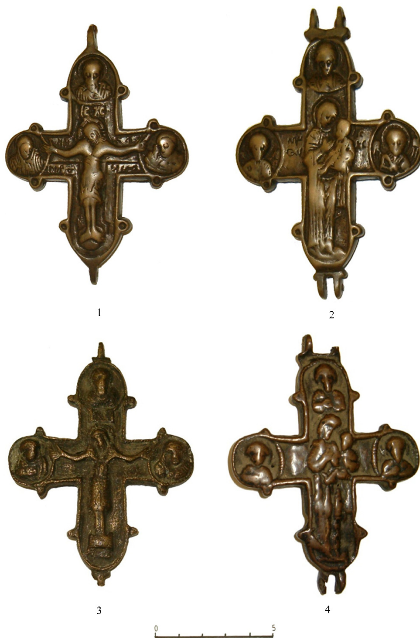
Fig. 3. Cruciulițe-encolpion din bronz de tip A, cu imaginea lui Iisus Hristos crucificat (1, 3) și a Fecioarei Maria cu Pruncul Iisus în brațe (2, 4), din secolele XII–XIII, aflate în colecțiile Muzeului de Istorie de Stat din Moscova.