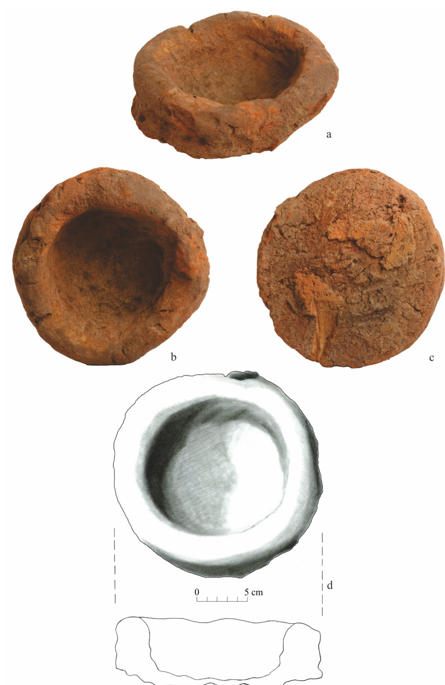
Fig. 4. Vatră portabilă din lut.