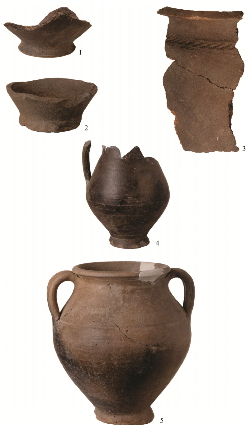
Fig. 3. Ceramică cenușie: 1–2. fragmente din partea inferioară a unor vase; 4. cană; 5. vas amforoidal; ceramică de culoare cărămizie: 3. fragment de vas.