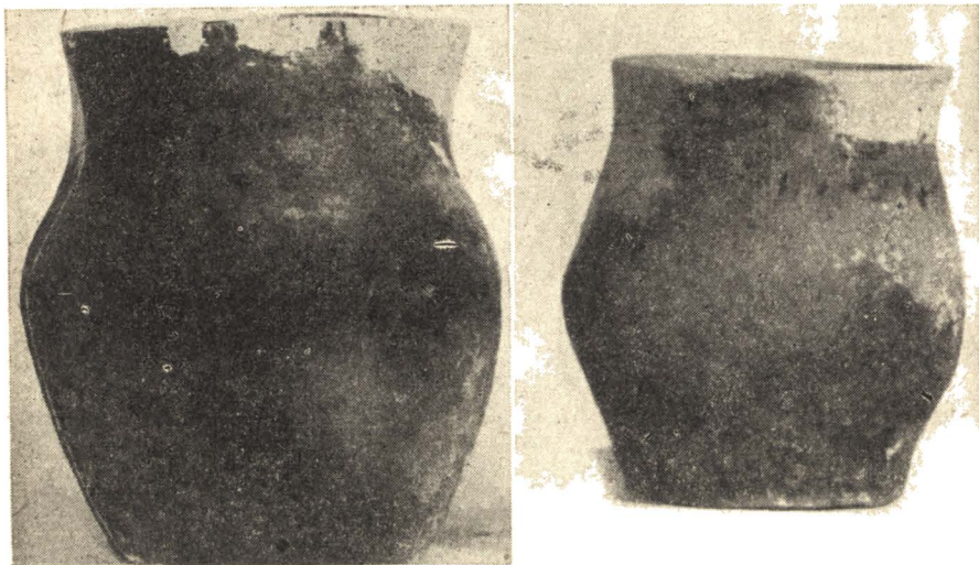
POARTA ALBA: Vas de lut descoperit în movila funerară.

În cuprinsul șantierului Fabricii de Ciment, din spre Apus de orașul Medgidia, în afară de o așezare din epoca migrațiunii popoare-