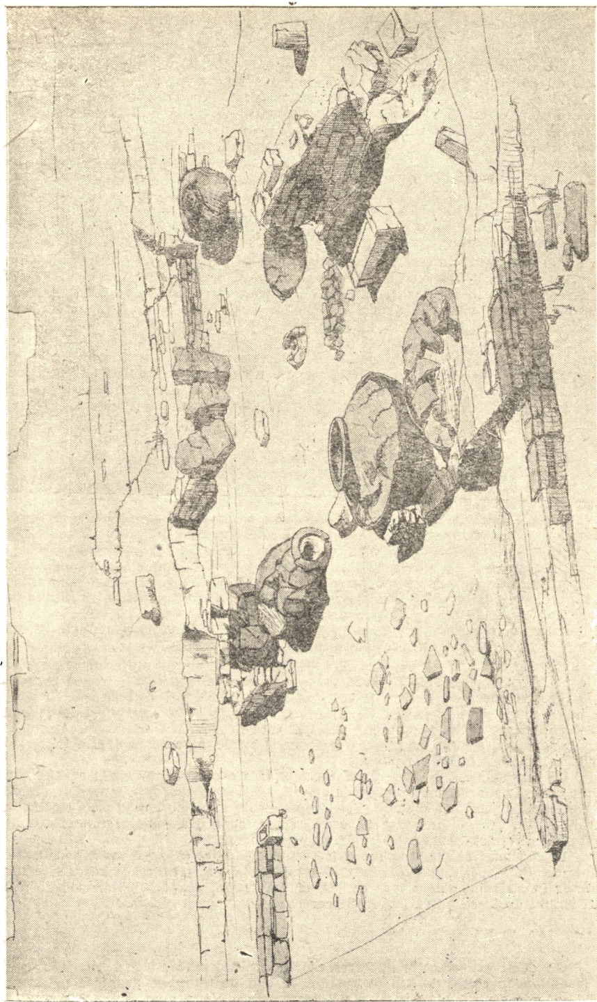
ISTRIA — Sala mare a atelierului descoperit în colțul Sud-Vestic al cetății