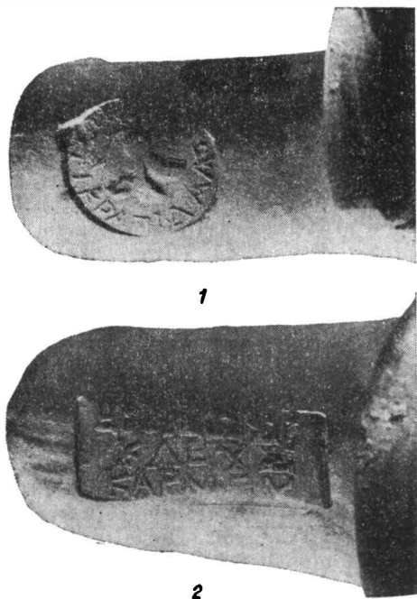
Fig. 1. — Axiopolis: Ștampele pe mînuși de amfore rhodiene.

Vasele din fig. 2/2,4 și pl. I/2 sînt de argilă nisipoasă fină, cu pereții subțiri și arse inoxidant, pînă la obținerea culorii cenușii. Unul dintre ele