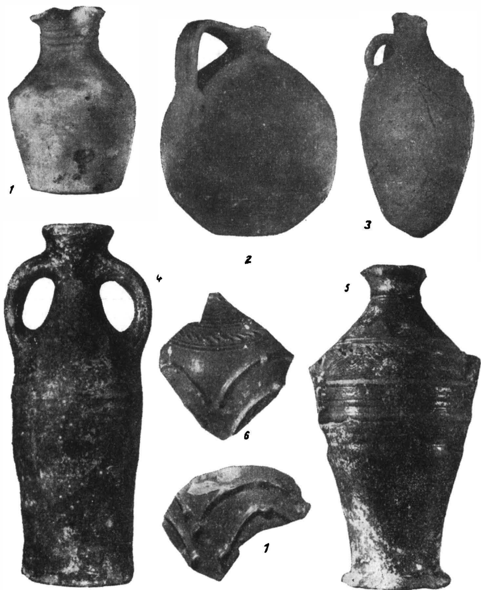
Pl. I. — Aziopolis : 1—3, ceramică de la sfârșitul sec. VI; 4—7, din sec. X—XI.