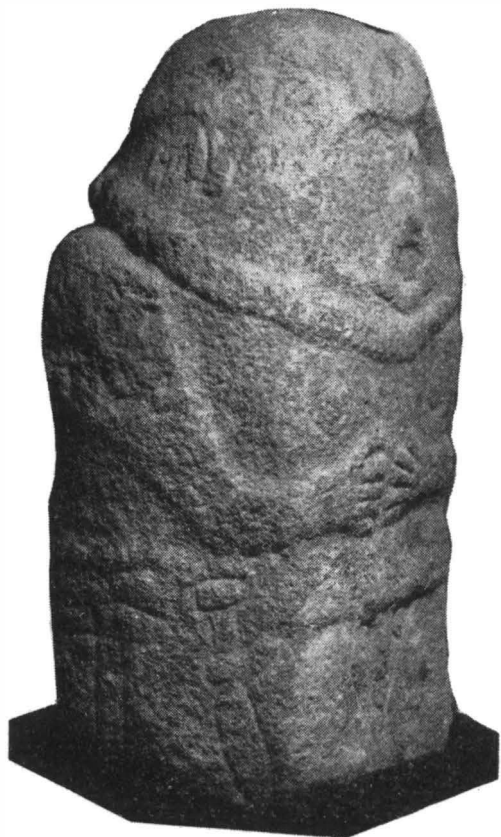
Fig. 1.— Statuia de la Sibioara. Muzeul regional Constanța.

și pumnale de tip akinakes, deși pînă acum nu s-au găsit niciodată chiar în același mormînt. În ambele necropole predomină elementele tracice.