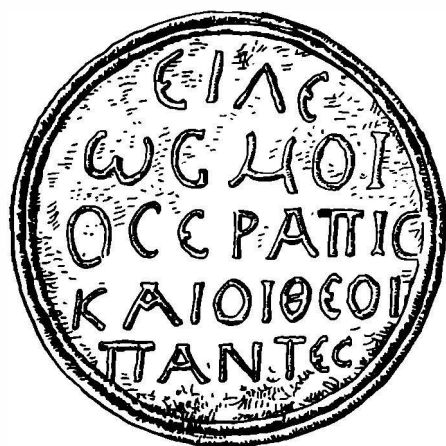
Fig. 3. — Medalionul votiv, CIG , III, nr. 6814.

s-au găsit și alte epigrafe grecești 1 , dovadă că elementele greco-orientale, numeroase, se manifestau și prin scris, în dedicații făcute zeilor. Textul medalionului (probabil piesă de import) este clar și simplu, bine citit și interpretat de toți care l-au menționat: