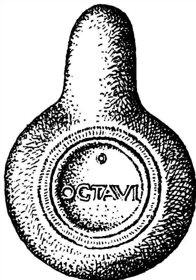
Fig. 2. -- Lucerna (opaișul), CIL, III, nr. 8076, 19.

În unele cazuri, greutatea lecturii ori greșeala e provocată în epigrafie direct de erudiții ori informatorii moderni, de felul cum ei privesc obiectele scrise și cum le așează ori le țin în mână. A fost semnalată o inscripție greacă « ilizibilă » din Bulgaria copiată de fotograf după un clișeu (film) inversat (răsturnat), din care a rezultat un text cu litere scrise... de la dreapta spre stînga 2 . Un caz apropiat este copia ce au făcut în a. 1842 frunzașii secui din Mihăileni după o inscripție răsturnată 3 , cu care se aseamănă « lectura » originală dată de G. Téglás unui opaiș stampilat din Sarmizegetusa. Publicînd o serie de materiale epigrafice romane 4 el menționează « Lampenstempel, 1) Várhely (Grădiște — Sarmizegetusa) a) LVPATI, b) IAVIDO ». Pe al doilea, CIL, III, 8076, 19, îl reproduce la « lucernae, Várhely (Devac in museo) IAVIDO », iar în index p. 2395 reface un cognomen « Iavidus » 5 . Este un nume absolut original, izolat la Sarmizegetusa, « unicum » pentru care în zadar ai căuta exemple ori analogii în orice parte, la oricare din grupele de provinciali. În afară de romanul Iavolenus , nimic din bogata și variata onomastică a numeroșilor supuși ai imperiului nu se aseamănă cu « Iavido ». Dar opaișul lui Téglás nu iese din seriile obișnuite ale acestor produse cu « marca fabricii » bine cunoscute în Dacia, căci lectura reală o dă obiectul