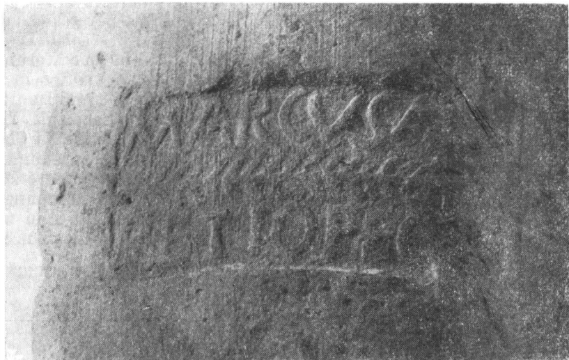
Fig. 2. — Ștampila de pe fragmentul de mortarium .

Fragmentul în cauză este unul dintre puținele cunoscute pe teritoriul patriei noastre care păstrează ștampila în întregime. Ștampilele