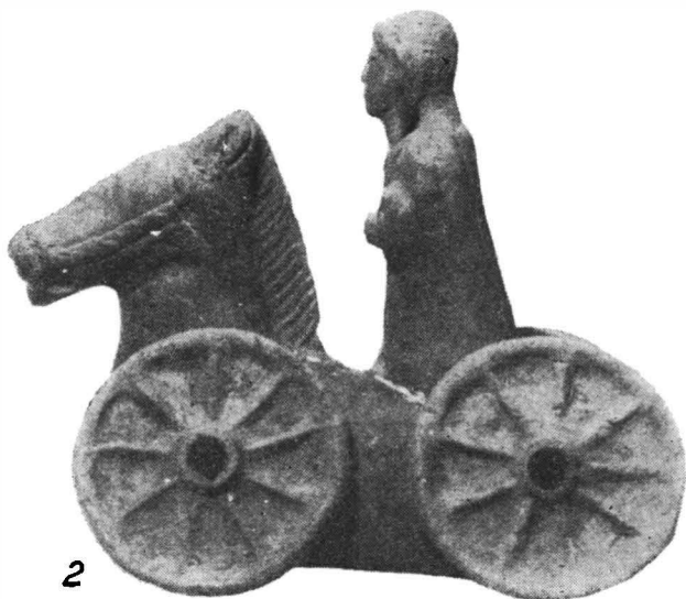
Fig. 1. — Celei . Figurină ecvestră.

botul rotund două găuri sugerează nările, iar o creștătură orizontală reprezintă gura. În partea inferioară, botul este perforat orizontal dintr-o parte în alta, pentru a se putea petrece o sfoară de care se trăgea piesa.