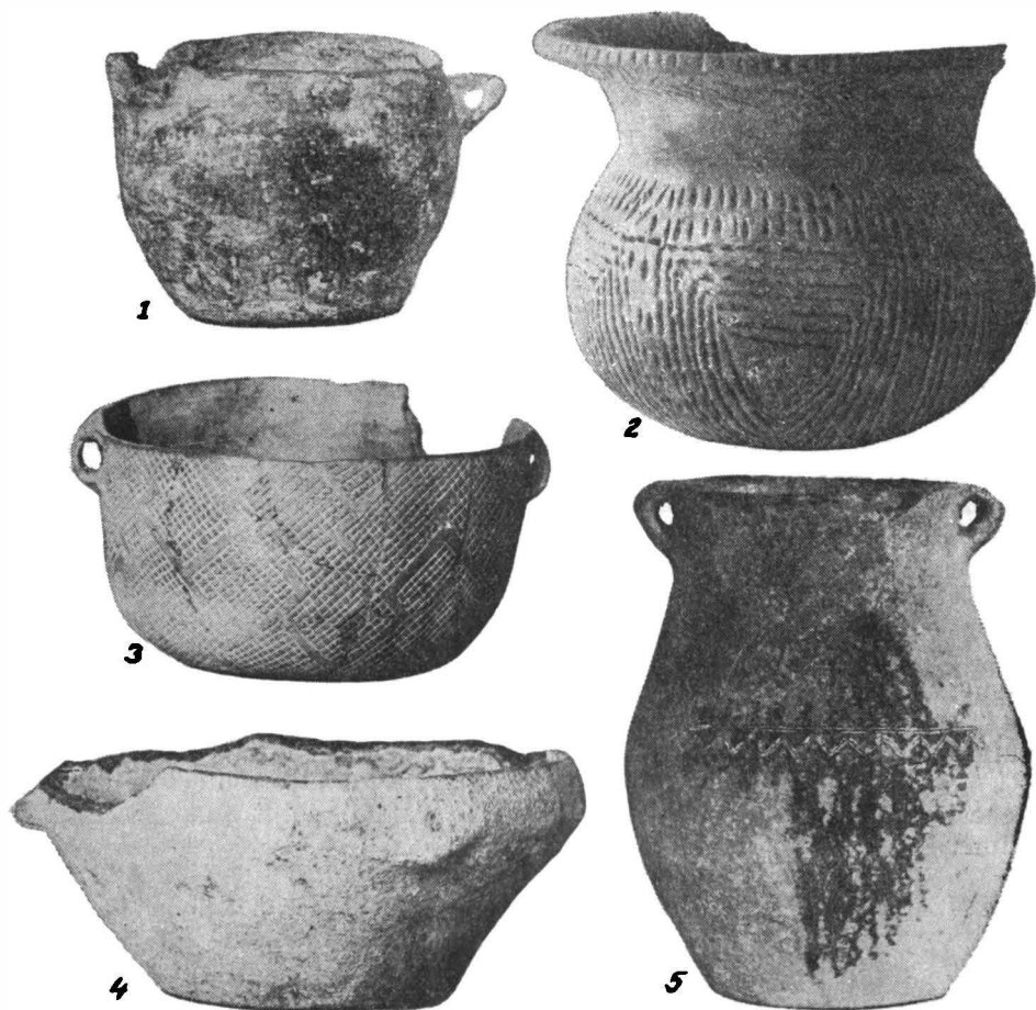
Fig. 2.—1,2, cupă Bodrogkeresztúr și ceașcă Coțofeni de la Valea Rea. Vase Bodrogkeresztúr: 3, Tg. Mureș; 4, Moldovenești; 5, Unirea.

materialului din fototecă) doar șase piese. Celelalte trei (numerele de inv. 1971, 1972 și 1977) n-am reușit să le găsim. Bănuim că vasele de la Gornești, alcătuind un complex închis, au făcut parte din inventarul