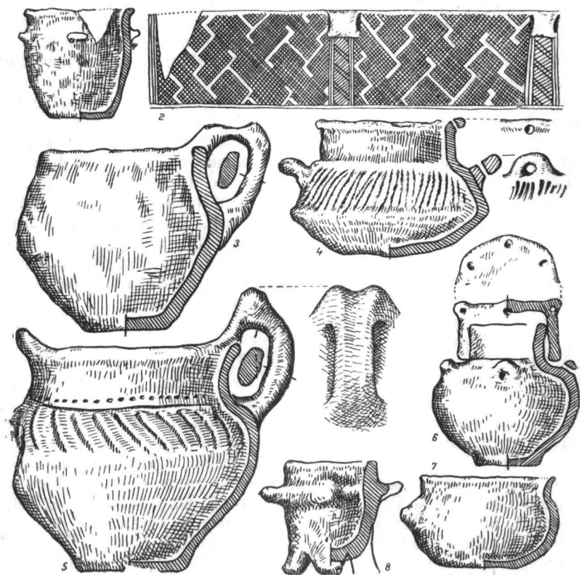
Fig. 3. — 1, vas Bodrogkeresztúr de la Moci; 2, ornamentul desfășurat al vasului de la Tg. Mureș; 3—5, vase Bodrogkeresztúr de la Valea Rea; 6, Ocna Sibiului ; 7, Luduș; 8, Corpadea.

Ocna Sibiului (rn. Sibiu, reg. Brașov). În vechiul inventar figurează următoarea descriere : „Mică ulcică de lut cu gîtul strîmt; pe gît un capac.