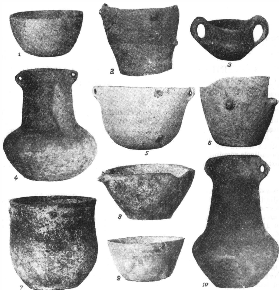
Fig. 1. — Vase aparținând culturii Bodrogkeresztúr. 1 — 6, Gornești; 7, Bogata de Mureș; 8, Cluj; 9, 10, Gheja.

„oală de lapte” ( milchtopfförmiges Gefäß ). Pastă cenușie, fină, bine arsă, rezonantă. Pe linia diametrului maxim patru mici gurguie conice, dintre care trei s-au dezlipit (fig. 1/10). Inv. I.7480.