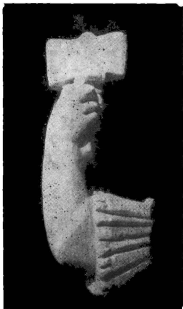
fig. 2. — Fragment din monumentul lui Iupiter Dolichenus de la Cerna (mărit de două ori).