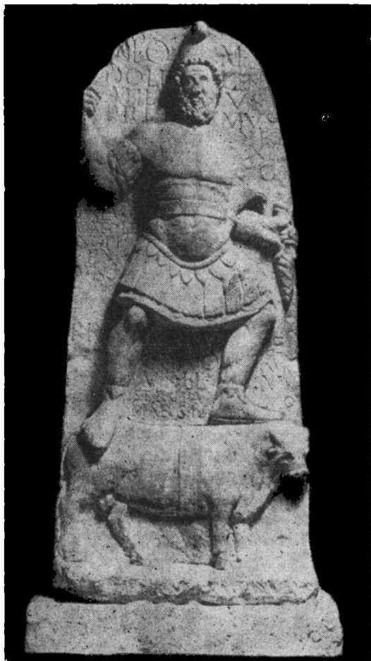
Fig. 3. — Monumentul lui Iupiter Dolichenus de la Carnuntum. →

aici din cele mai îndepărtate localități orientale. Acestea au adus cu ele amintirea zeităților și a localităților lor de origine, fiind însoțite de un bogat tezaur de obiceiuri și tradiții, pe care, desigur, le-au transmis și populațiilor autohtone 16 .