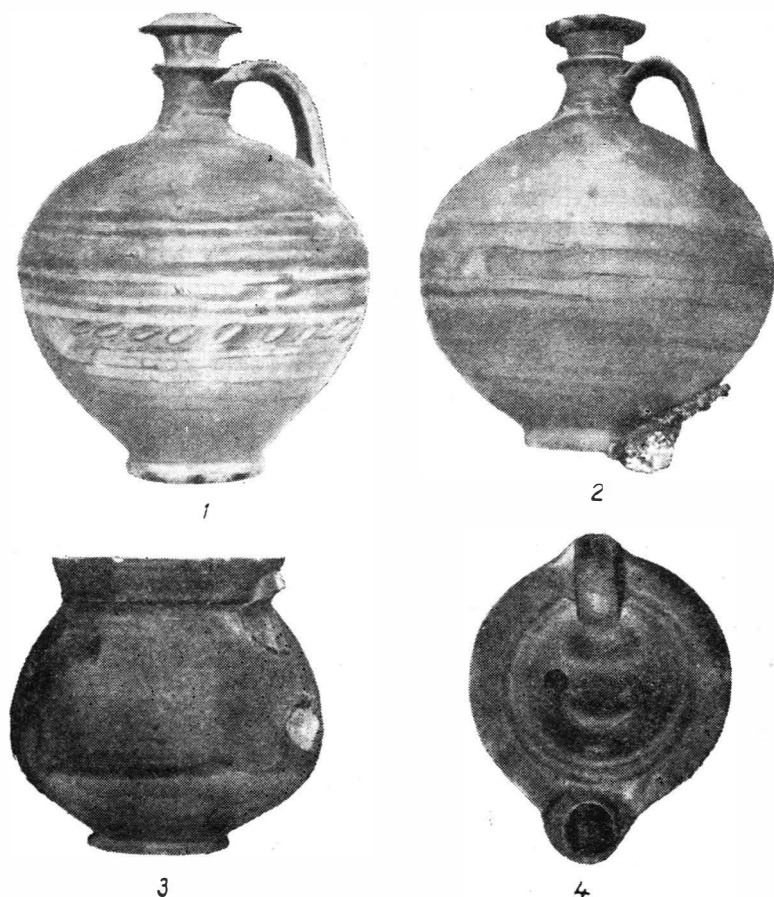
Fig. 2. Histria. Obiectele ceramice din mormînt; 1—2 urcioare; 3 căniță; 4 opaiț.

de pe corp sînt mai rare și mai puțin reliefate, fără alveole. Ambele vase par a fi fost produse în aceeași serie, de același atelier, cu o mică diferență de culoare a argilei, rezultat al poziției deosebite din cuptor.