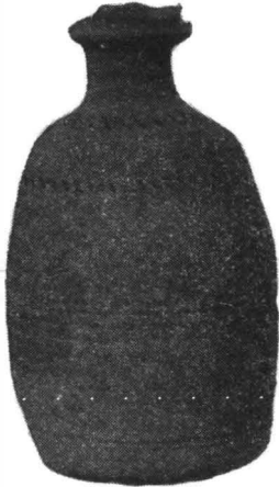
Fig. 2. — Urcior de la sfîrșitul sec. VI și începutul sec. VII.

Dat fiind, că acest grup ceramic, pe de o parte, este necunoscut pînă acum în așezările romano-bizantine, iar pe de altă parte, se individualizează prin cîteva particularități între care cele mai izbitoare sînt forma vaselor și fundul bombat cu „umbo”, propunem ca el să fie numit de tip „Hinog”, adică după numele așezării unde a fost descoperită pentru prima dată.