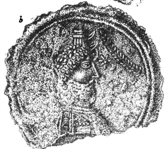
Fig. 1. — Apulum. Terra sigillata. a, Esculap și Higy; b, Serapis.

femeie. Bărbatul cu barbă reprezintă pe Esculap, zeul medicinei, în picioare, cu bustul pe jumătate gol, capul încununat cu un lemniscus , restul corpului acoperit de un pallium , prins pe umărul stîng cu o fibulă rotundă. În mîna dreaptă poartă obișnuitul baston pe care se încolăcește șarpele, animalul nedespărțit în toate reprezentările figurate ale lui Esculap, el fiind de altfel atributul său principal 1 . Mîna dreaptă o întinde spre cel de-al doilea personaj. Nu se poate observa dacă ține sau nu ceva în mîină, deoarece tiparul este erodat în această regiune.