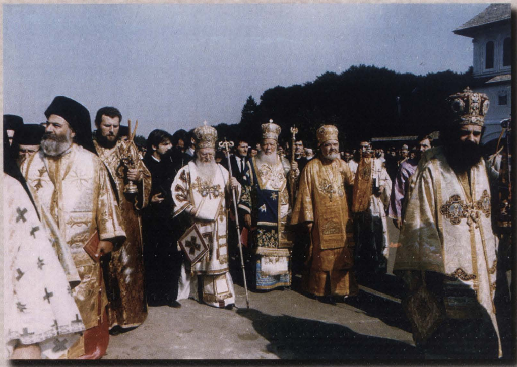
Foto 1 și 2: La sfințirea Mănăstirii Brâncoveanu, Sâmbăta de Sus. Sanctitatea Sa, Patriarhul ecumenic, Bartolomeu I, P.F. Părinte Patriarh Teoctist și Î.P.S. Mitropolit Antonie.