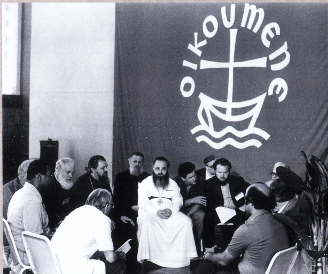
Geneva, 1977. Convorbiri la Consiliul Mondial al Bisericilor.

https://biblioteca-digitala.ro/ / https://bibsinosd.ro