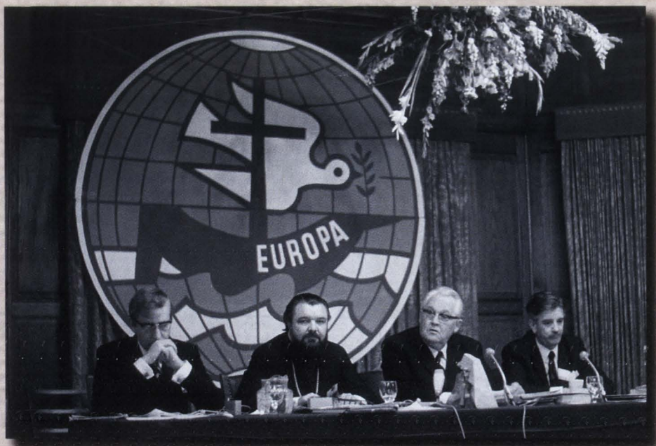
Prezidiul Conferinței Bisericilor Europene la Engelberg, Elveția, septembrie 1974