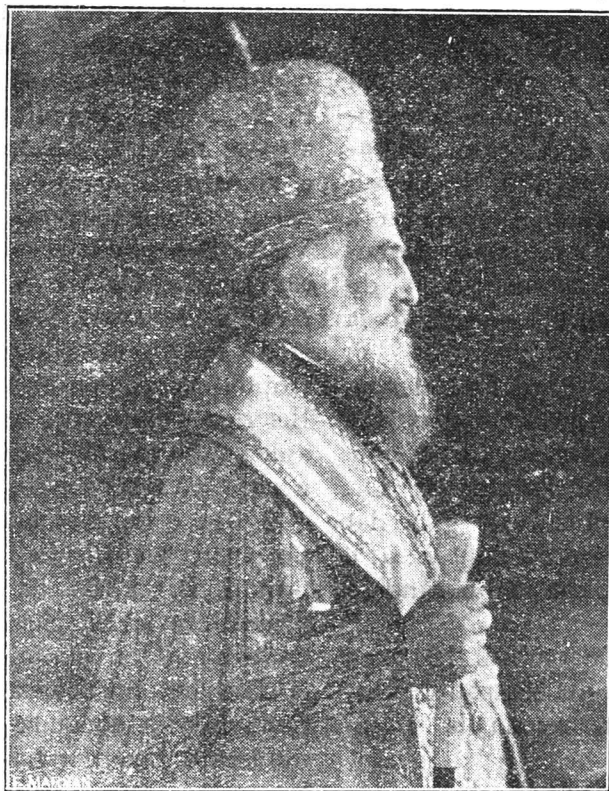
La cârma Bisericii...

CURIERUL ARHIEPISCOPIEI ORTODOXE ROMÂNE DIN BUCUREȘTI MITROPOLIA LUNGROVEAHEI APARE SUB PĂRINTEASCA INDRUMARE A S.S.D.D. DR. MIRON CRISTEA I UL PATRIARH AL ROMÂNIEI.