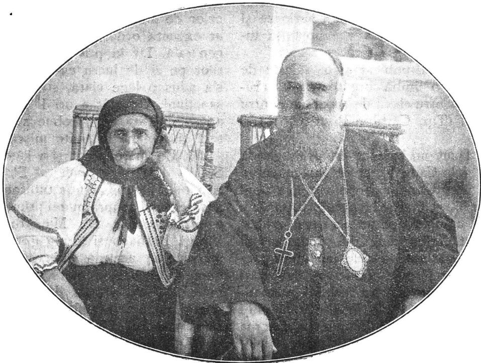
MAMA ȘI TESCICUL...