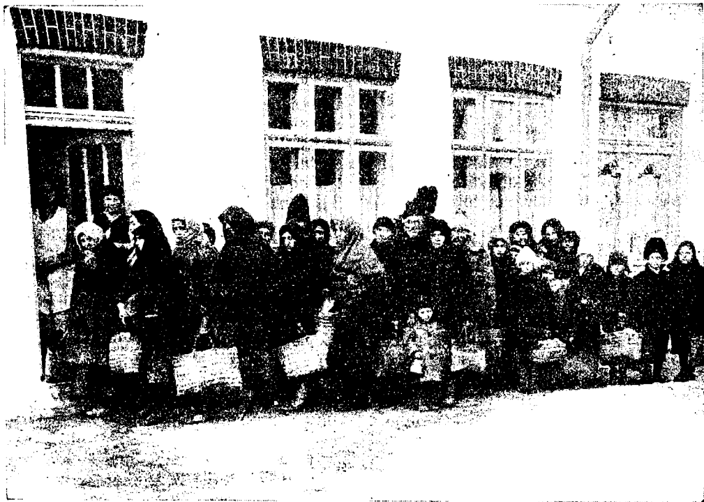
Șirul celor veniți să primească hrana zilnică la Cantină