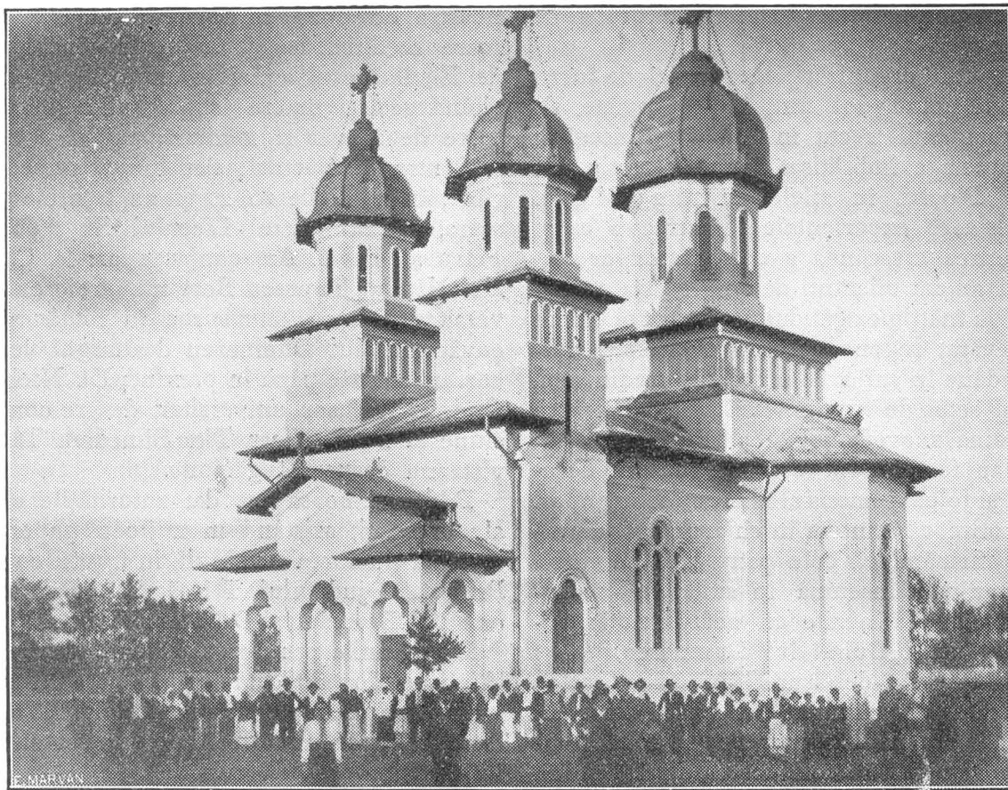
Biserica donată Sf. Arhiepiscopii a Bucureștilor de către d-l L. Stătescu

Dar tocmai când eră pe terminate această măreață biserică, a venit timpul de grea încercare al marelui războiu. Biserica e complect terminată la exterior. La interior însă pictura, de o execuție minunată—dupăcum se afirmă de cei ce au văzut-o — e lucrată