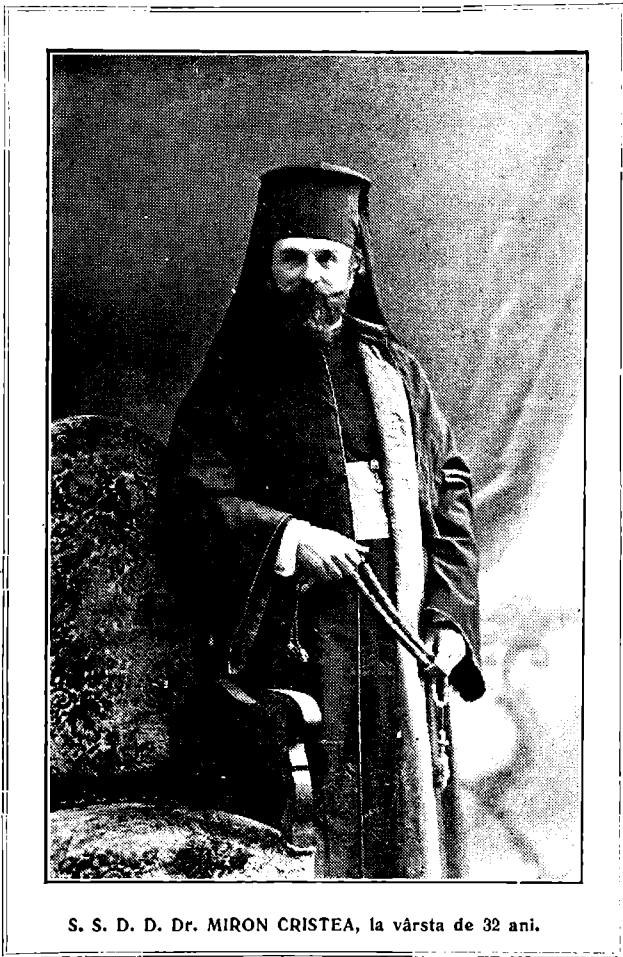
S. S. D. D. Dr. MIRON CRISTEA, la vârsta de 32 ani.

— Sf. Scriptură este pentru noi oamenii, aceea ce-i mama pentru copilul cu care trece peste o punte îngustă. Copilul merge înainte, iar mama îl urmează, ținându-l cu mâna de haină, ca să nu se prăbușească și răstoarne în apă, în prăpastie. (pag. 67).