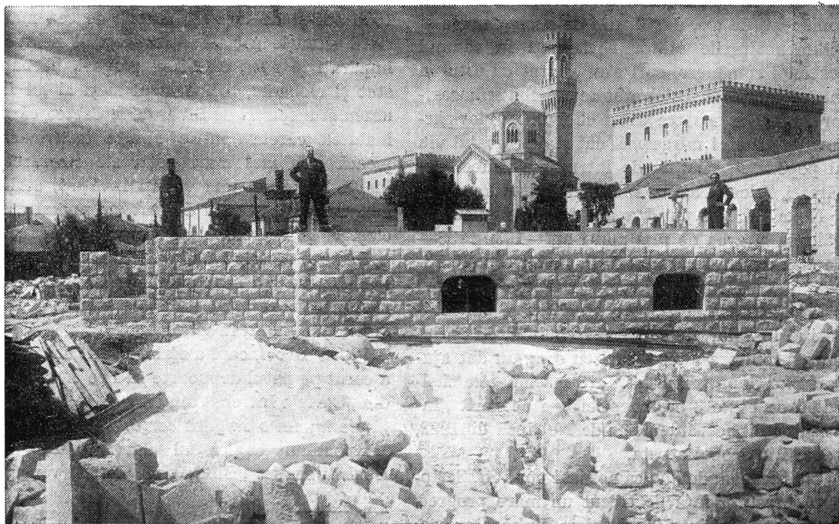
Stadiul în care se găsește zidirea bisericii și a căminului dela Ierusalim, întârziat puțin din cauza grevei Arabilor.

Deși nu suntem în ajunul Crăciunului, aceste cuvinte mi-au venit și Mie în minte și pe buze, când am văzut ieșită din tiparnița patriarhiei noastre întreaga Nouă Sfântă Scriptură, tradusă în limba noastră deadreptul din limbile originale, în cari au fost scrise cărțile ei.