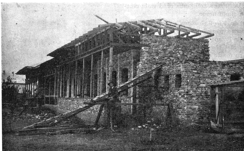
Frăţia misionară „Patriarhul Miron“ — pe lângă propaganda învăţăturilor bisericeşti, combaterea sectelor, masă la săraci etc., adună mijloace spre a face şi un mic „Cămin pentru câţi-va săraci. El e acum în zidire, cum arată fotografia“. Va avea 6 camere pentru 6 femei sărace.