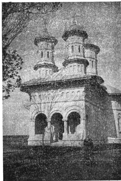
Biserica din Ciofliceni.

După stăruința sa au fost împrejmuite, reparate și înfrumusețate, bisericile din Lipia și Bojdani. De asemenea la Ciofliceni prin îndemnul și prin o însemnată contribuție bănească a Sf. Sale, s'a pus temelie și s'a zidit o frumoasă clădire de biserică. Pe teren economic, a luptat și susținut înființarea băncilor populare și cooperativelor: Malu-Roșu, Isbânda și Căldărușani, al cărui președinte a fost 10 ani. Harnic lucrător în via Domnului, bun îndrumător al trebuirilor obștești, nu mai puține merite are ca pă-