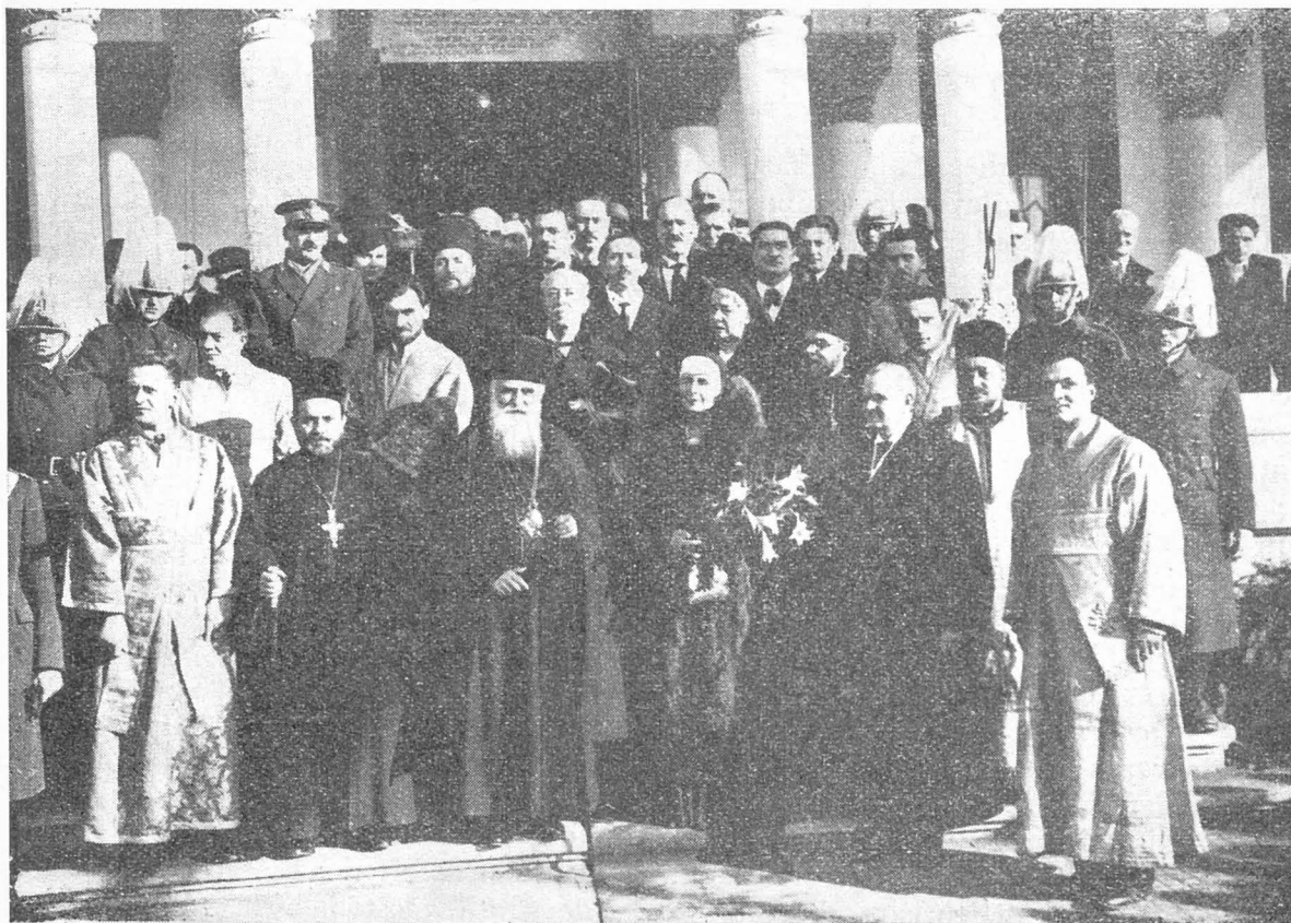
Sfințirea bisericii „Sf. Maria” din parohia „Patriarhul Miron” din București.

Nici legea statului, nici hotărîrea Sfân-