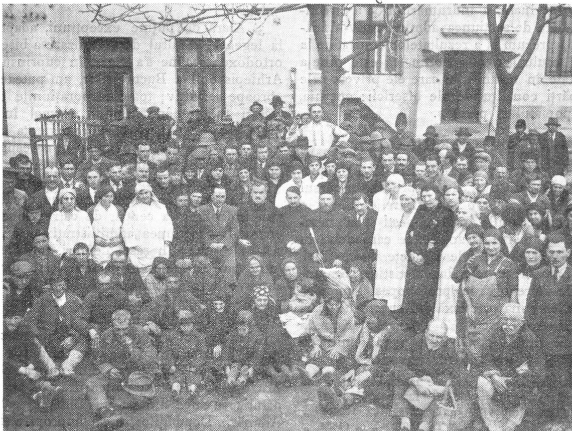
Adunarea săracilor dela Asociația „Patriarhul Miron” și Comitetul