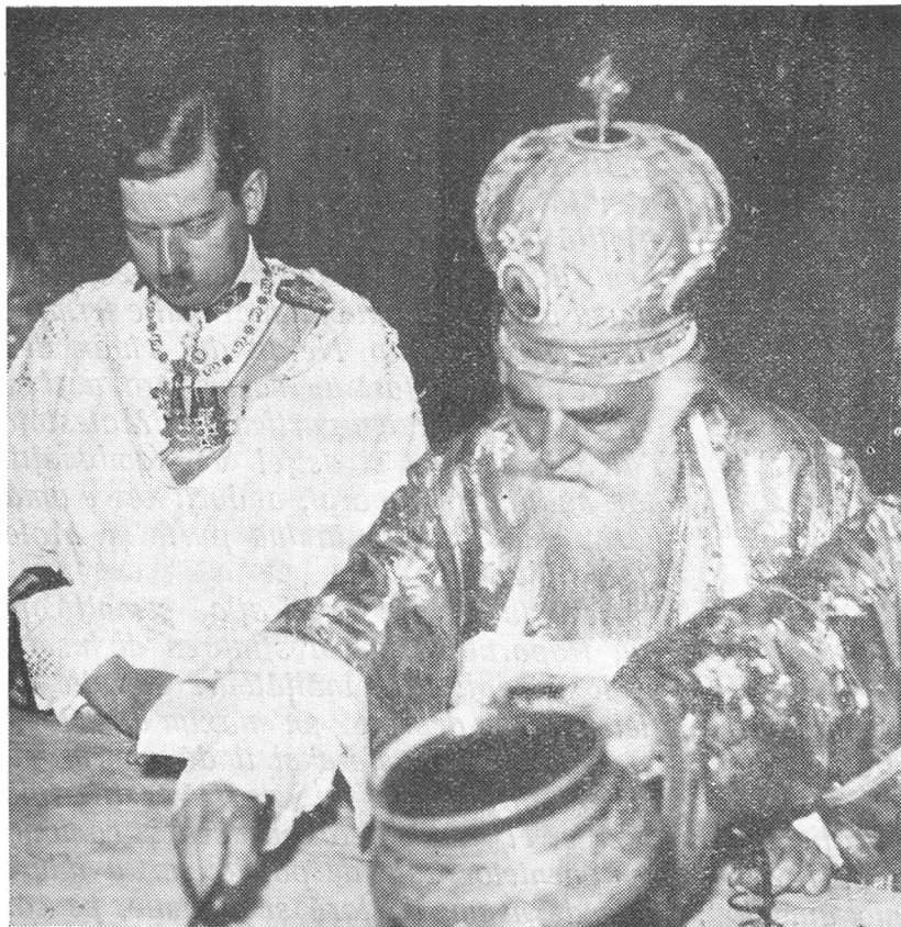
Sfințirea Sfintei Mese din altar

Așezată în mijlocul satului, într'un stil arhitectonic, impunător, biserica aceasta s'a construit grație sprijinului material al bunilor creștini, în urma apelului I. P. S. Patriarh și al ziarului „Universul“, reușindu-se să se adune aproape 10 milioane. În afară de biserică și înzestrarea ei cu tot ce-i trebuie s'a construit din acelaș fond casa parohială și o capelă pe locul unde a ars vechea biserică de lemn.