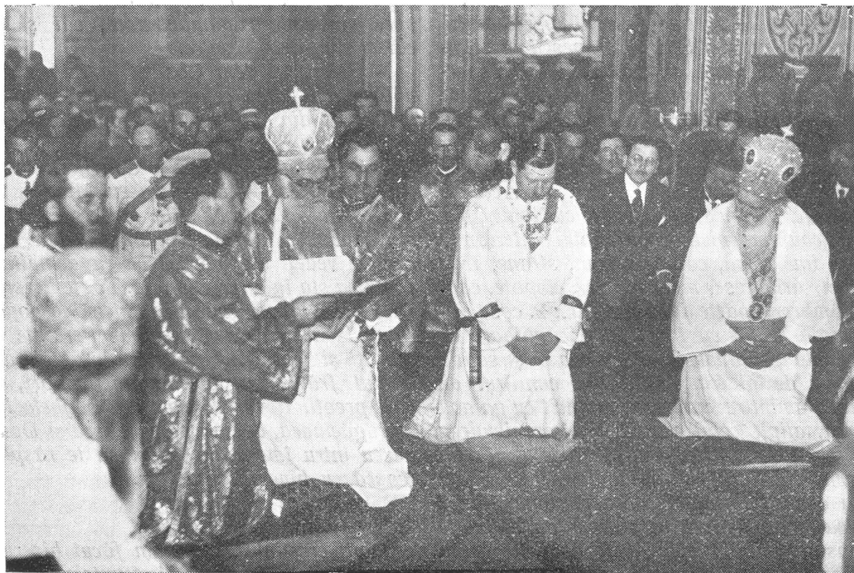
Serviciul religios la Sfințirea Bisericii din Costești.

Dar la temelia acestei impozante bise- rici, — care prin soliditatea și frumusețea