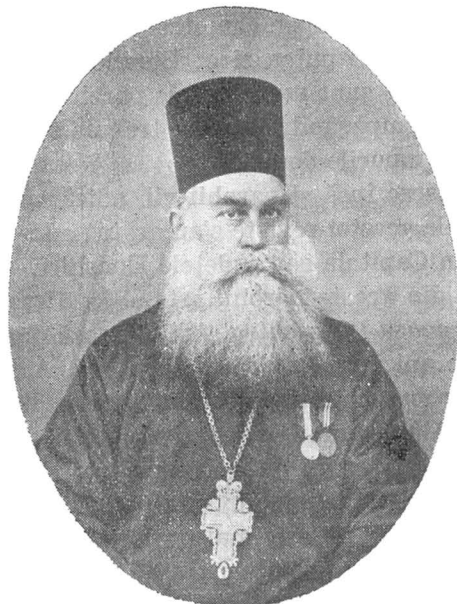
Pr. Econom Mihai Popescu

La 15 Octombrie 1918 cu ordinul nr. 1603 a fost numit Președinte al Spiritualului Consistoriu al Sf. Mitropolii a Ungro-Vlahiei.