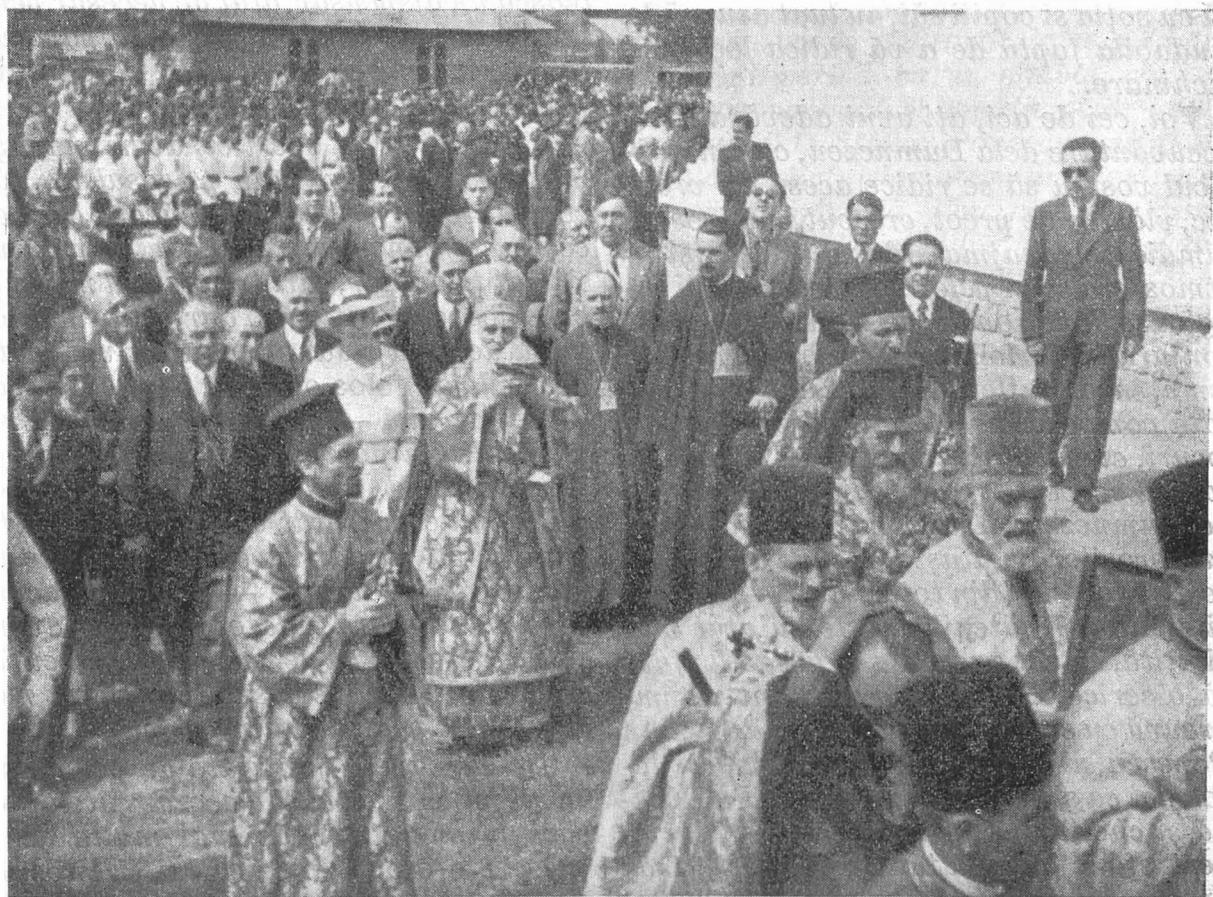
Procesiunea religioasă în jurul Bisericii „Sf. Stelian”: I. P. S. Patriarh înconjurat de înaltul cler și urmat de ctitorii sfântului locaș.

CUVÂNTAREA I. P. S. PATRIARH MIRON CRISTEA LA SFINTIREA BISERICII DIN COMUNA „STELIAN POPESCU“ PRAHOVA 6 Iunie 1937