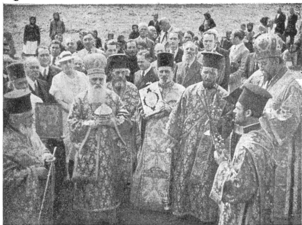
Serviciul religios al sfințirii, condus de I. P. S. Patriarh Miron.