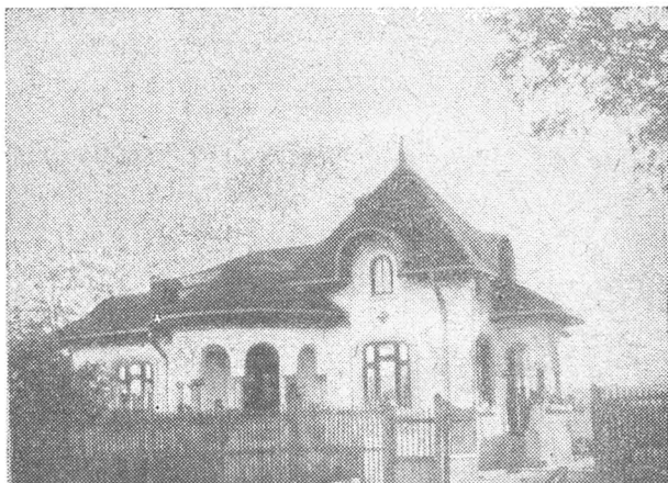
Casa parohială a Bisericii Poddeanu, zidită în anul 1932

Săracii vin zilnic cu coșurile și vasele lor, pentru a lua mâncare acasă și pentru ceilalți membri ai familiei lor; deci în realitate se hrănește zilnic, prin biserică—dela 200 de suflete în sus— în mod gratuit.