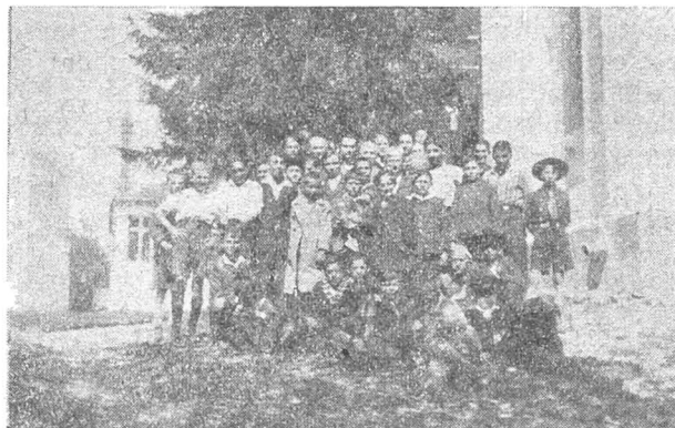
Elevii dela liceul „T. Maiorescu“, excursie la Sfânta Mănăstire Pasărea de lângă Capitală.