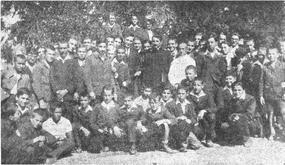
Elevii liceului „T. Maiorescu” din București, vizitează Sf. Mănăstire Cotroceni de lângă palatul regal Cotroceni.

nește la trebuințele ei materiale, anihilându-i orice avânt superior. Ea vrea să meargă cu forțe reînoite către idealul moral, pentru care Mântuitorul s'a jertfit pe cruce, așteptând doar imboldul care s'o mîne, cu pute-