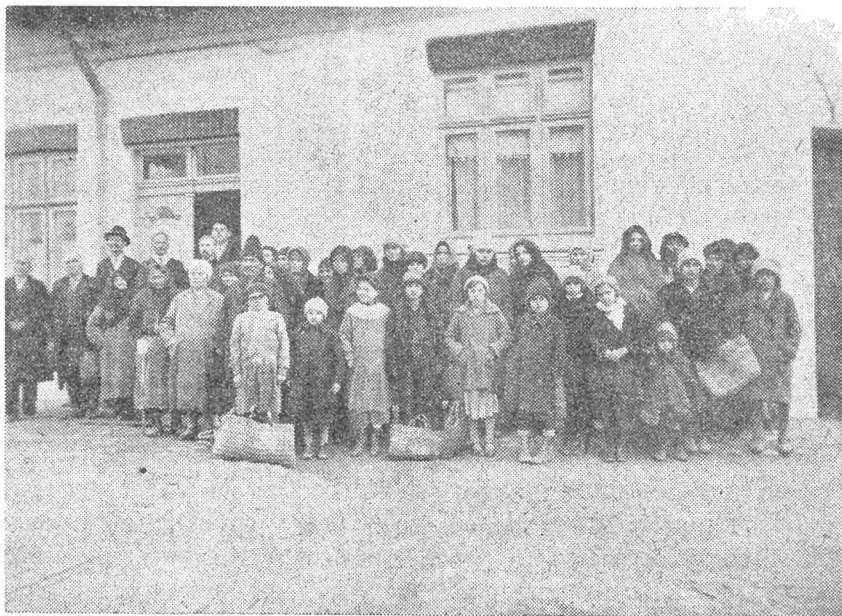
Cantina Bisericii Poddeanu cu un grup de săraci așteptând să ia mâncare.