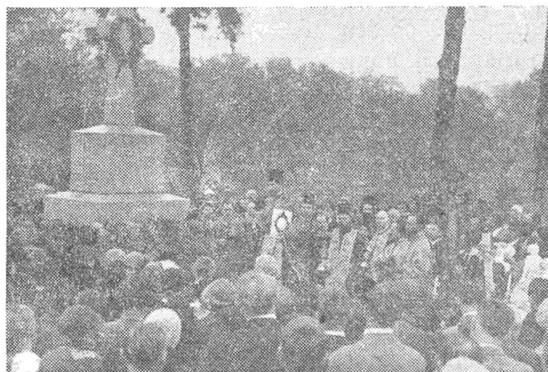
Procesiunea la mormântul doctorului Carol Davila lângă azilul „Elena Doamna“.

Mai mult ca oricând se simte nevoie de a strânge pe credincioși în jurul preoților, de a lupta pentru apărarea sfintei cruci, ca în timpul împărătesei Teodora, pentru cinstirea sfintelor icoane. Când lupta noastră va porni din credință sinceră și dragoste frățească, vom avea siguranța izbândeii.