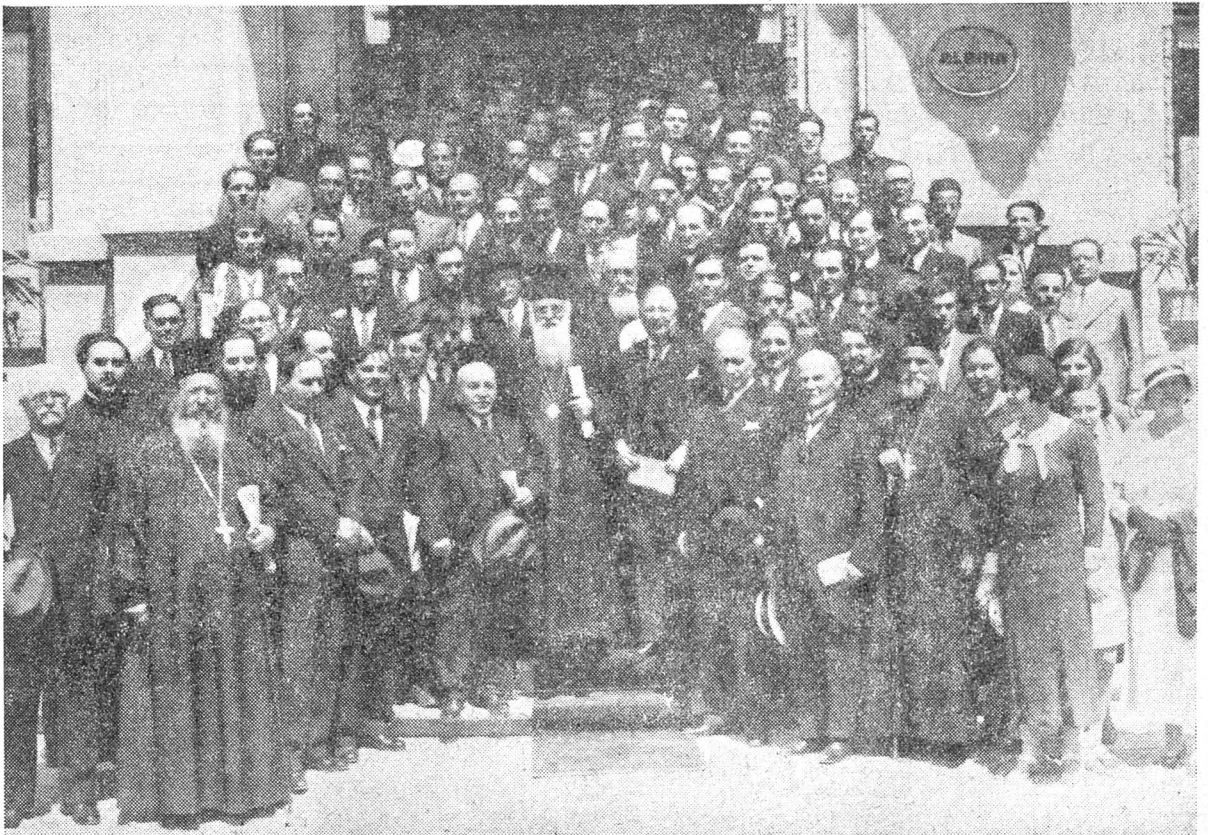
I. P. S. PATRIARH în mijlocul conducătorilor fundațiilor regale și tineretului universitar cu misiunea de propagandă culturală în țară.

să îmbrățișeze însăși acțiunea creștină. Căci educația creștină integrală, pusă în serviciul idealului pedagogiei creștine, nu se poate opri la educația intelectuală, nici la educația religioasă, ci trece mai departe la educația morală creștină.