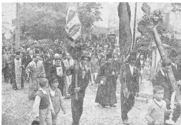
Procesiunea din cartierul Sf. Elefterie.

moarte s'au împlinit 50 ani. Prin el s'a stabilit o alianță sufletească până la contopire între Franța și România. Până la el noi nu aveam în țară decât foarte puțini medici și aceia mai mult greci.