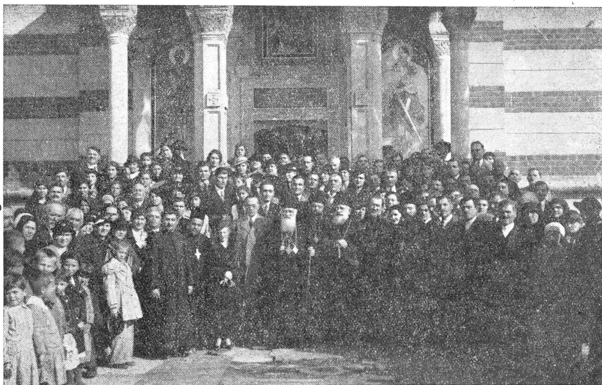
Redeschiderea Bisericii Andronache din Capitală în ziua de 28 Octombrie a. c. în prezența I. P. S. Patriarh,

Căci scopul acestor cercuri pastorale a fost și este, ca preoții, diaconii și cântăreții să contribuie la luminarea poporului și întărirea lui religioasă. Iar în ceea ce privește elementele colaboratoare, cercurile pastorale oferă pri-