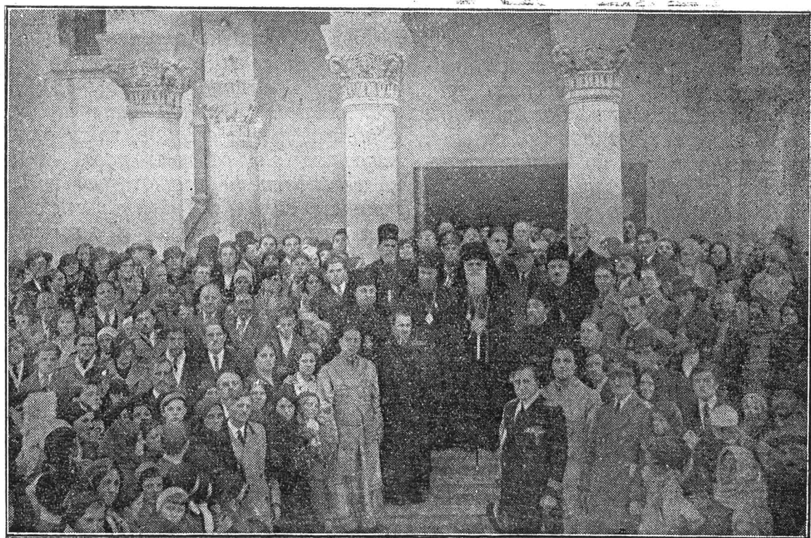
Solemnitatea Sfințirii Bisericii „Sf. Treime-Ghencea“ din București. Duminică 11 Noembrie 1394.

Pe locul unde înainte, cu sute de ani, Horia și cu tovarășii lui au fost trași pe roată, se înălța acum falnica tribună de unde avea să se rostească sentința indispu-