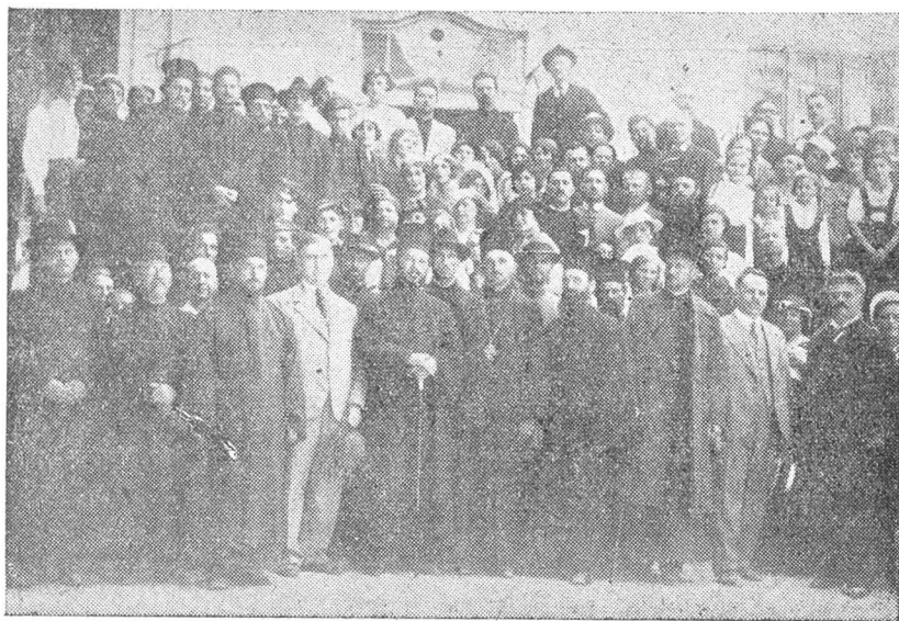
Excursioniștii noștri primiți de clerul bulgar la Nicopole în Bulgaria.