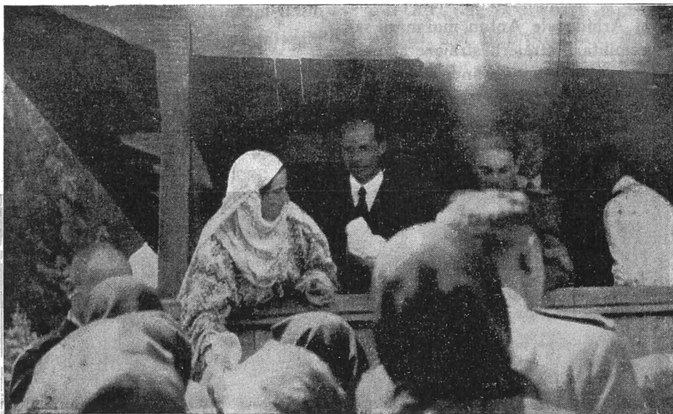
Arhiducesa Ileana și Arhiducele Anton, pe prispa bisericii, impart daruri săracilor din satele brănene cu prilejul sfințirii bisericii.

pe care mereu le poartă — ingenunche ascultând ruga pentru odihna sufletului Augustei mame, poporul o urmează în lacrimi și suspine, văzând în chipul Ei de zână pe mama Suverană, în zâmbetul și glasul Ei melodios, pe al aceleia ce-l stătuia și lumina, în mâna ei miluitoare, pe-aceea ce-l cerceta și ajută, tămăduind dureri și neajunsuri.