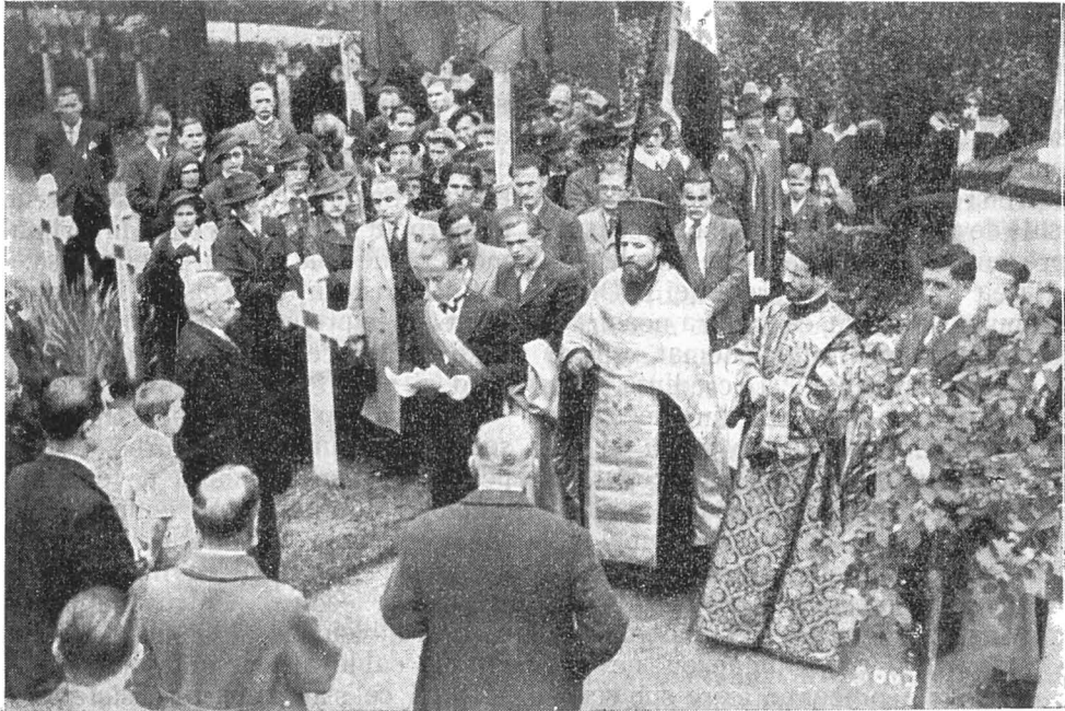
Asistența, în timpul sfintei slujbe.

Sosiți în lagăre, viața nu era deloc schimbată. Închiși cu sutele în barăci de lemn, expuși frigului și umezelii, flămânzellii, oboșiți și chinuți de dorul copiilor, soțiilor, părinților, țării, s'au stins rând pe rând ca o poveste dureros de tristă. Mulți, cu lacrimi în ochi, cădeau în genunchi și rugau femeile alsaciene să le dea voie să să-