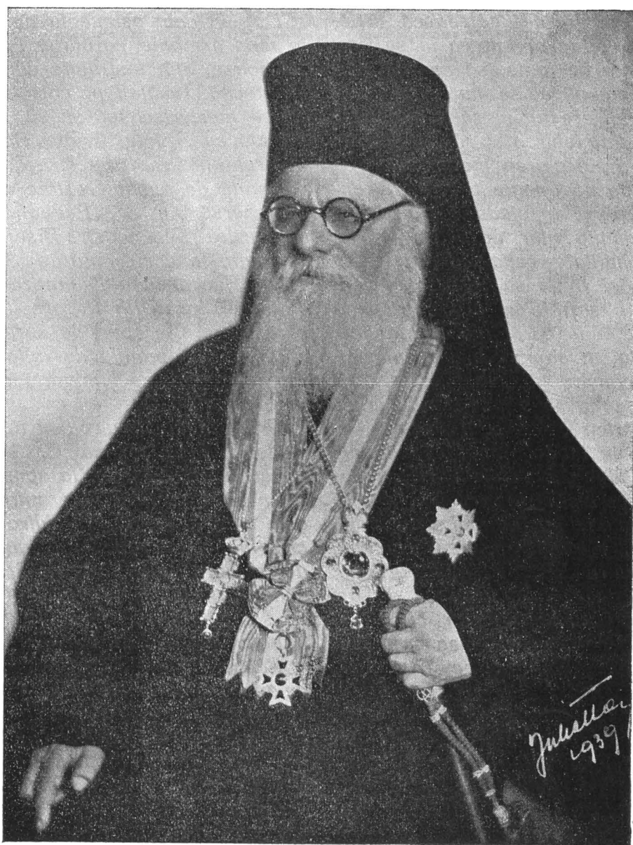
I. P. S. ARHIEPISCOPI AL BUCUREȘTILOR MITROPOLIT AL UNGRO-VLAHIEI D. D. NICODIM PATRIARHUL ROMÂNIEI

Arhiepiscopia Bucureștilor SECȚIA ECONOMICĂ