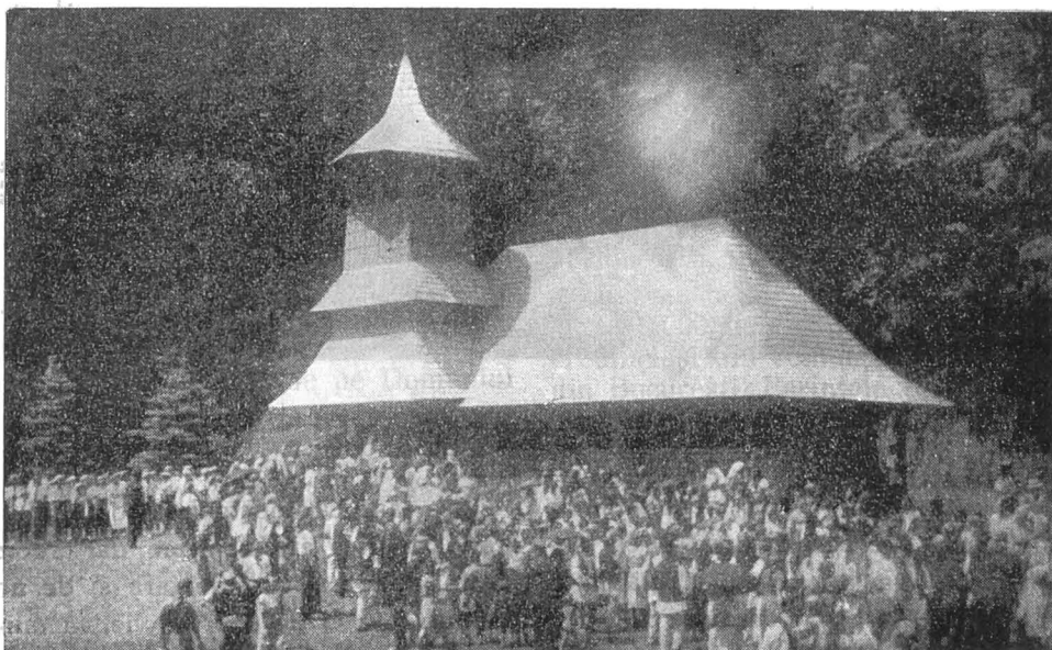
Biserica de lemn din Parcul Castelului Regal din Bran.

Ea a fost așezată aci de Regina Mamă, în brădetul încântătorului Ei parc, plăsmuit și înfrumusețat cu flori și tot ce numai mintea Ei de artist desăvârșit a putut face, ca o plinire a setei și nevoii sufletului Ei ce năzuia neconținut mai sus, ca un locaș dumnezeesc în care să înalțe rugii fierbinți, din care gândul și sufletul Ei plin de