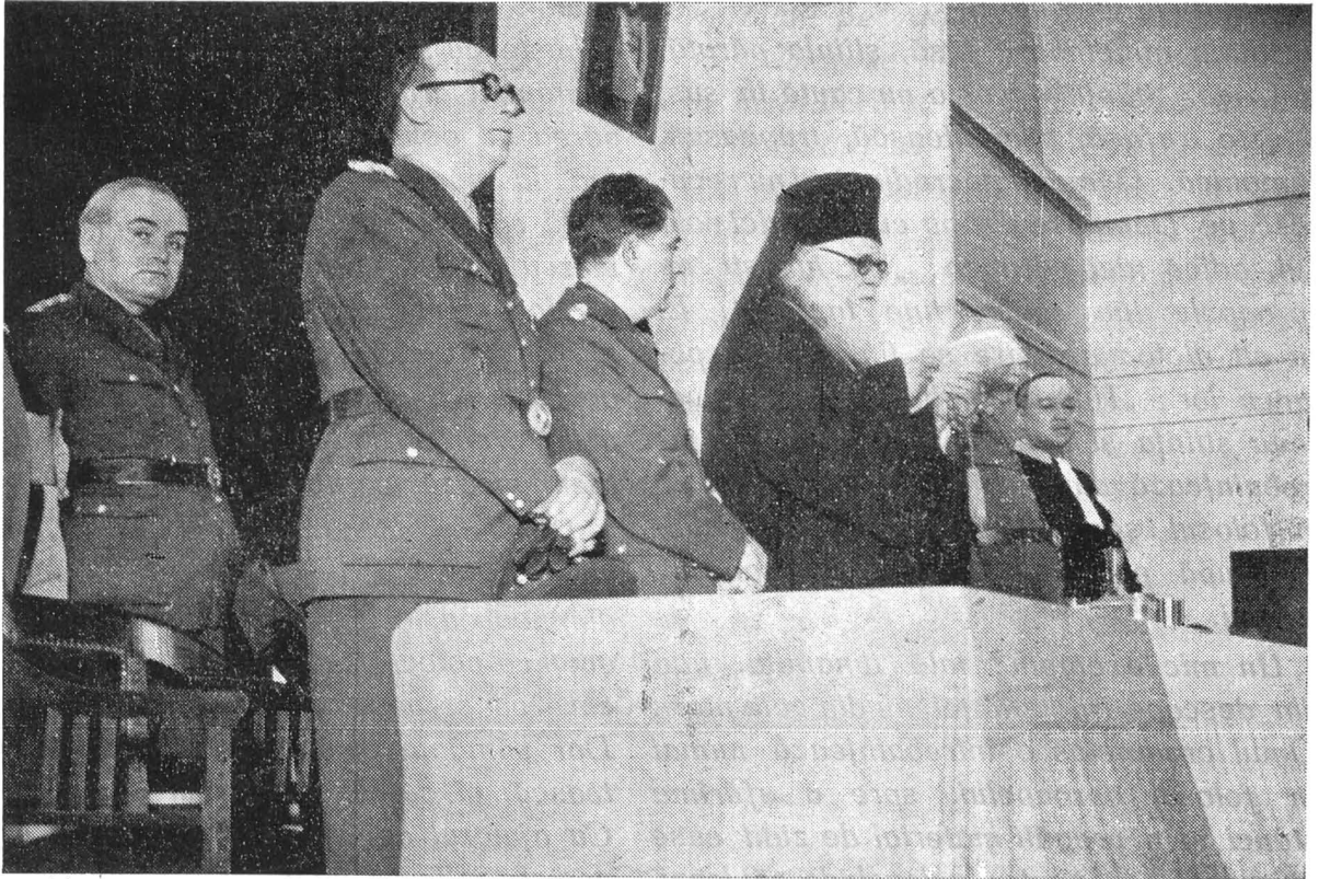
Înalt Prea Sfințitul Patriarh Nicodim vorbind studenților la deschiderea noului an universitar.

Știința este atribut, însușire dumne- zeiască, la care Dumnezeu a făcut păr- taș numai pe om, cum credința este dar dumnezeesc, pe care Dumnezeu l-a sădit