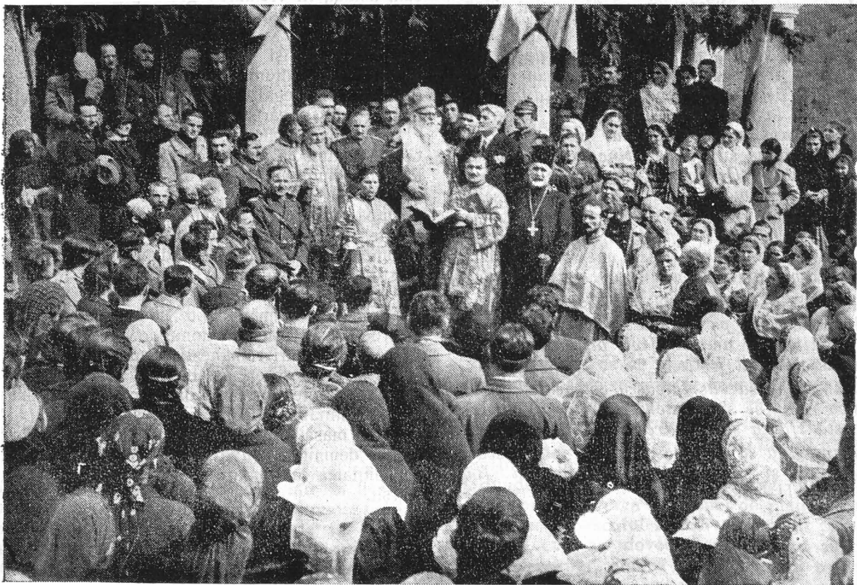
La sfințirea bisericii din com. Stoenști-Muscel.

Ba acei smeriți dascăli mai făceau și altceva fiindcă acele cărți, ce le purtau ei în traistă