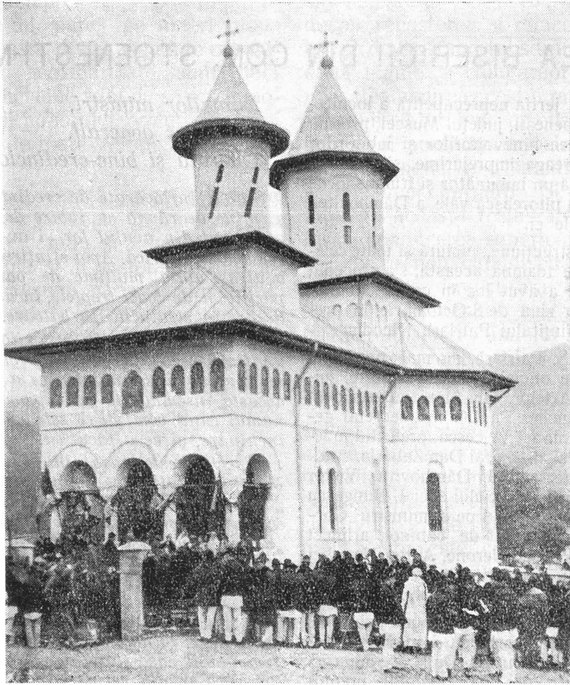
Biserica nouă dela Stoenеști-Muscel.

Donul sau treptele din fața altarului. Bânci care mai puțin — stranele —, pentru că învățătura aicea e despre Dumnezeu și mântuirea omului și ea trebuie ascultată în genunchi sau în picioare. Elevi sunt toți lacuitorii satului sau ai târgului. Profesor e preotul. Are cărțile cele mai de seamă: Evanghelia — cuvântul Domnului; apostolul — învățătura apostolilor; 12 cărți mari cu imne de laudă și de proslăvire a lui Dumnezeu și a sfinților Lui, pline de învățatură pentru creștini. Alte 12 volume mari — Viețile sfinți-