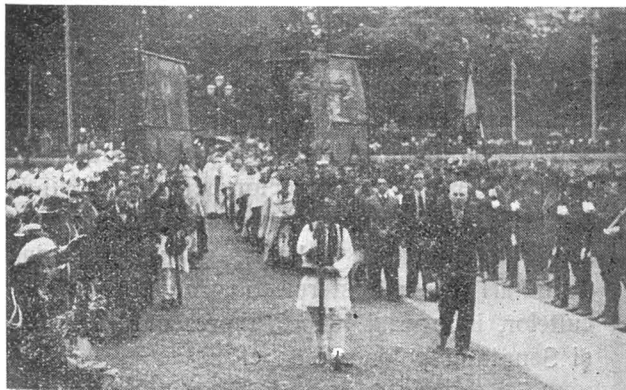
Cernăuți. Credincioșii și clerul îl conduc pe I. P. S. Patriarh la Catedrală

Călduroasele cuvinte de bună venire, pe care ați binevoit a mi le adresa, mă ating