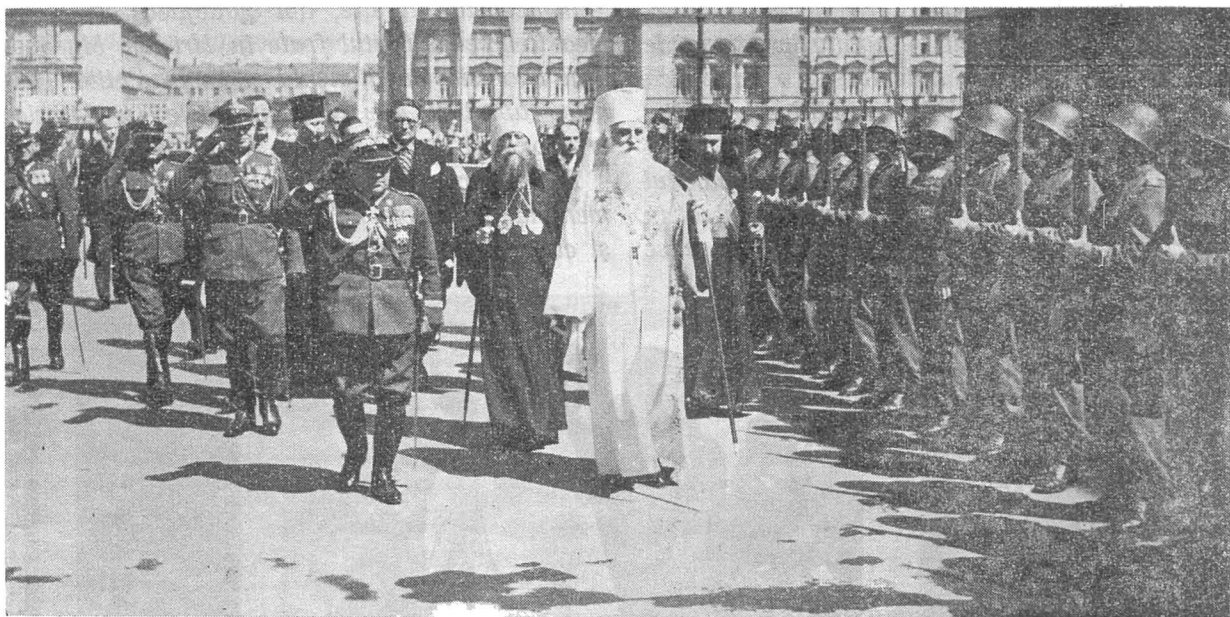
I. P. S. Patriarh Dr. Miron Cristea merge să depună o coroană la mormântul eroului necunoscut

din București, iar statul polon ne-a crescut teologi români la facultatea teologică ortodoxă din Varșovia.