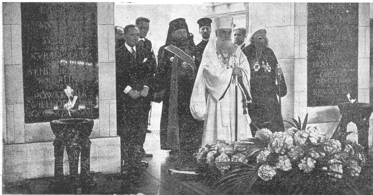
La mormântul eroului necunoscut din Varșovia

Faptul, că națiunea polonă a răspândit și menținut în aceste părți ale Europei civilizația și cultura latină și că este o nație cu adânci