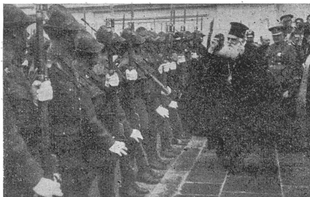
Cernăuți. I. P. S. Patriarh eșind din Catedrala Sf. Mitropolit

Incepând din tinerețea mea — și mai ales după contactul cu studenții universitari poloni din străinătate — m'am gândit întotdeauna la același vis de independență, de