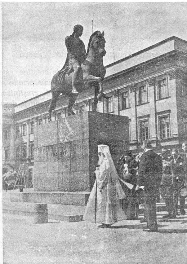
În fața statuii principelui Iosif Poniatowski, în drum spre mormântul eroului necunoscut din Varșovia

Și numai din aceste câteva date reiese cât de vechi, de veacuri, sunt legăturile bisericii române cu biserica ortodoxă a Poloniei.