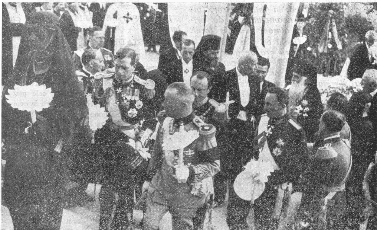
La Argeș. — Patriarhul vorbește cu principele de Wied fost Rege al Albaniei