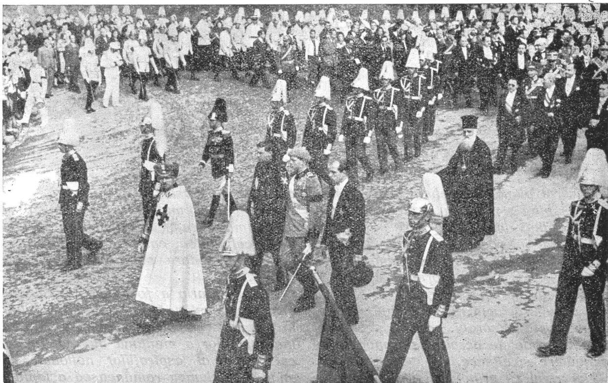
Procesiunea dela Sinaia spre gară. Inmormântarea Reginei Maria.

culturală, prin organizarea sa de model, prin simțul său de comerț și prin așezămintele sale industriale și de muncă ordonată — și-a creat nu numai o patrie slăbită și respectată de toată lumea, ci și-a extins dominațiunea și asupra tuturor continentelor, unde are atâtea colonii în plin progres spre o nouă viață. Ea a fost trimisă pe pământul țării noastre de providența divină — ca un sol neprețuit — tocmai în timpul cel mai critic al