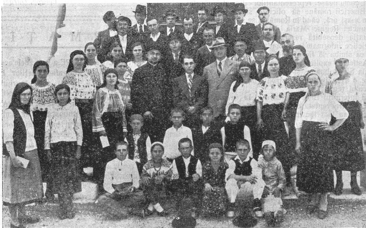
Echipele misionare și școlile de catehizare în protopopiatul Cir. I Teleorman.