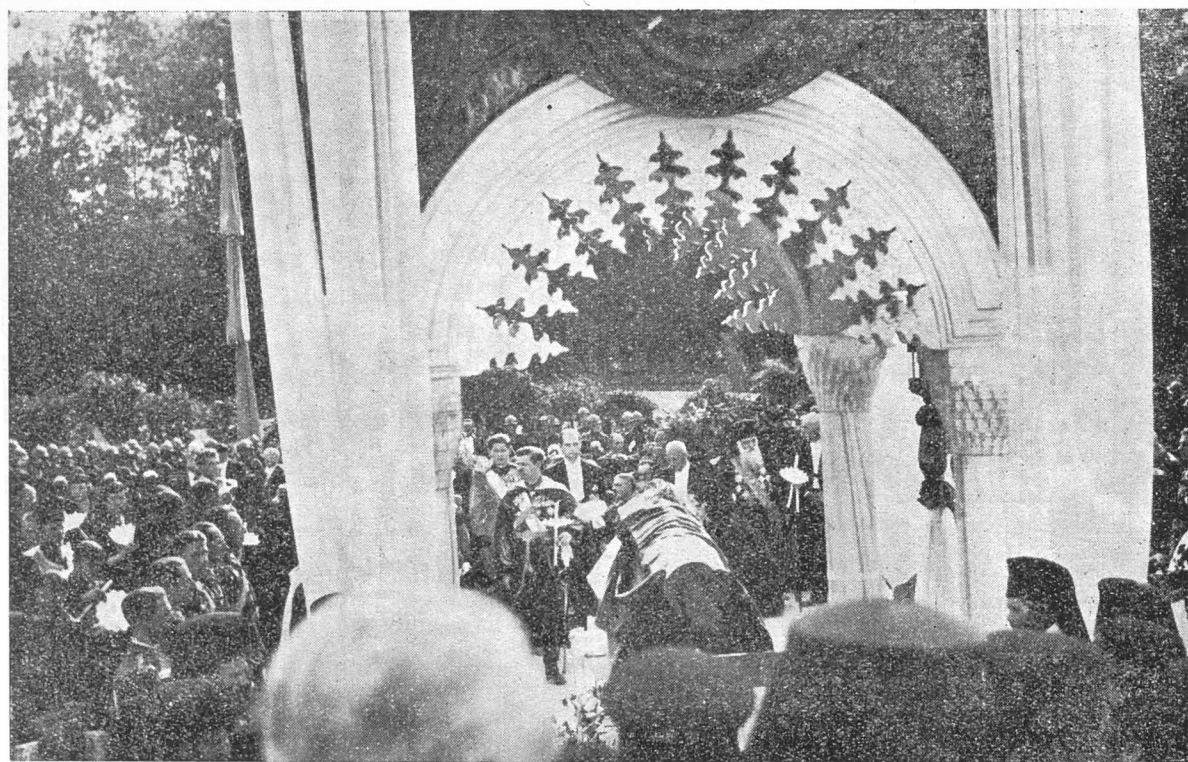
Prohodul Reginei Maria la Argeș