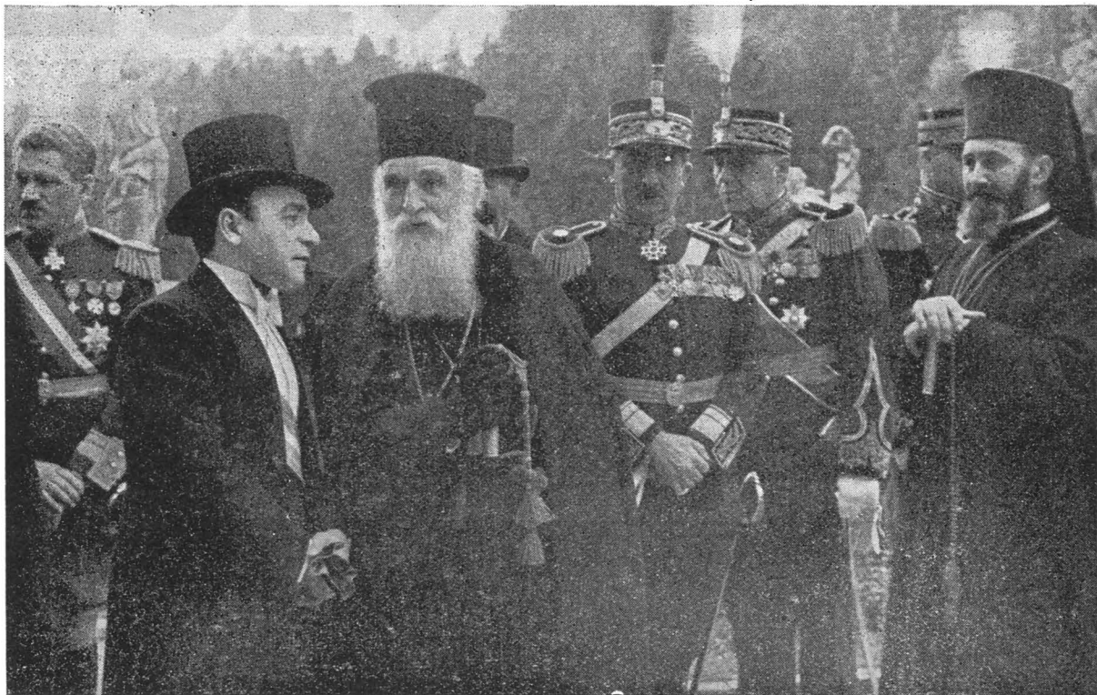
I. P. S. Patriarh și membrii guvernului la Sinod, după decesul Reginei Maria.

noștrii toate. Frumoasă țară pe care am văzut-o întregită, a cărei soartă am împărtășit-o atâția ani, al cărei vis strămoșesc l'am visat și eu, și mi-a fost îngăduit să-l văd împlinit. Fii tu veșnic îmbelșugată, fii tu mare și plină de