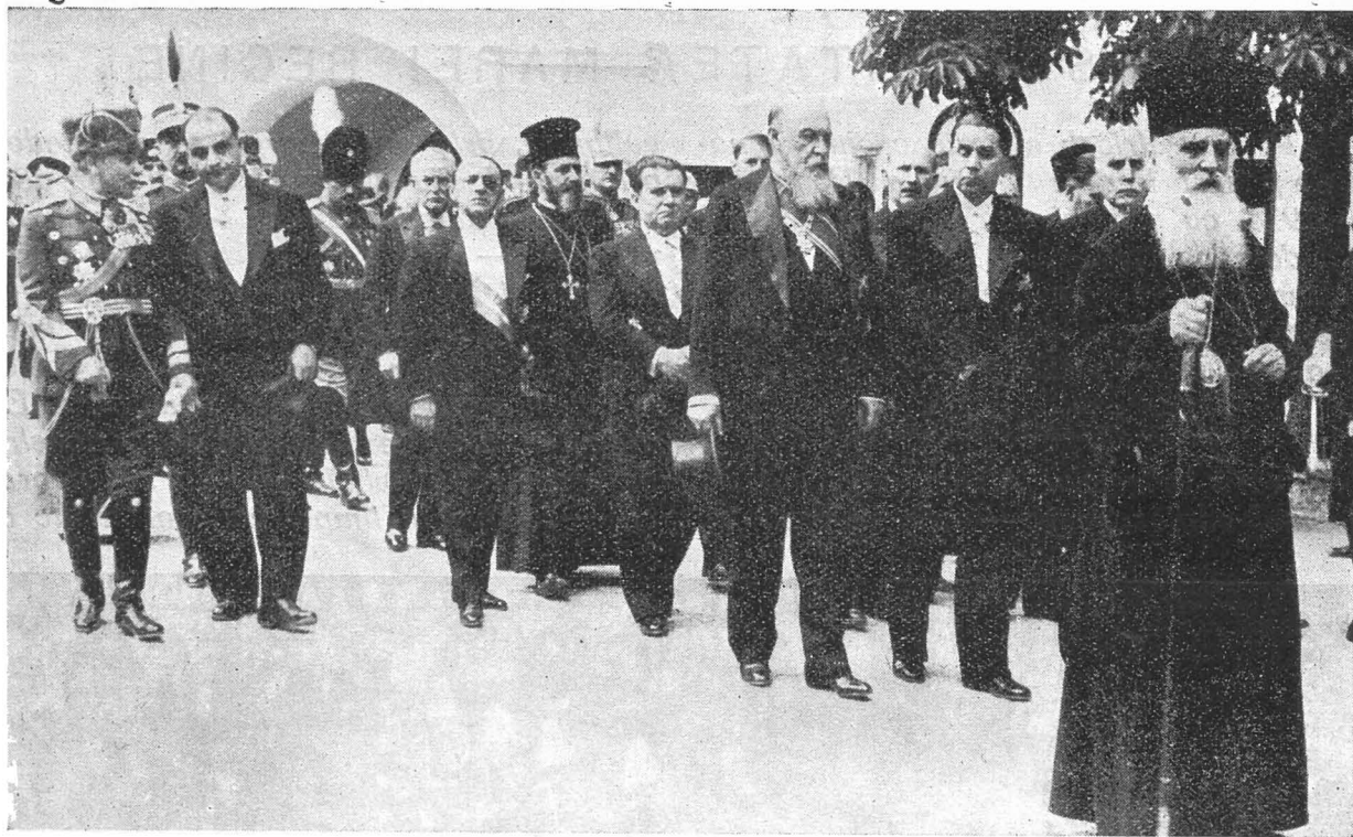
Procesiunea la Cotroceni, când a fost adus de la Sinaia corpul neînsuflețit. I. P. S. Patriarh, Consilierii regali și guvernul.

noi în hora de foc, la care se înșiraseră atâtea țări. Aveam atâtea nedreptăți de biruit. Fruntașii țării — conducătorii de atunci — au avut prevederea și buna chibzuință a intra de partea aliaților. Cu ei speram a ne desrobi partea cea mai mare din pământul robii străinilor. Dar — cum eram nepregătiți — am suferit decepții mai multe decât ne așteptam. Primele succese s'au schimbat repede într'un dezastru. Din țara veche abia mai rămăsese liber un biet trunchiu. Au urmat :