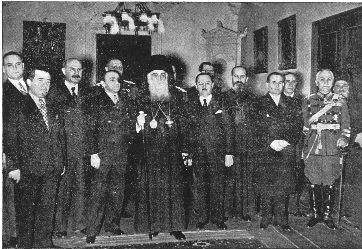
I. P. S. Patriarh, înconjurat de membrii guvernului, în sala festivă din palatul Sf. Patriarhii.

D. Gh. Ionescu-Sisești, Ministrul agriculturii și domeniilor, în numele guvernului a elogiat marea activitate pe tărâmul național și bisericesc a I. P. S. Sale și i-a urat încă mulți ani de viață.