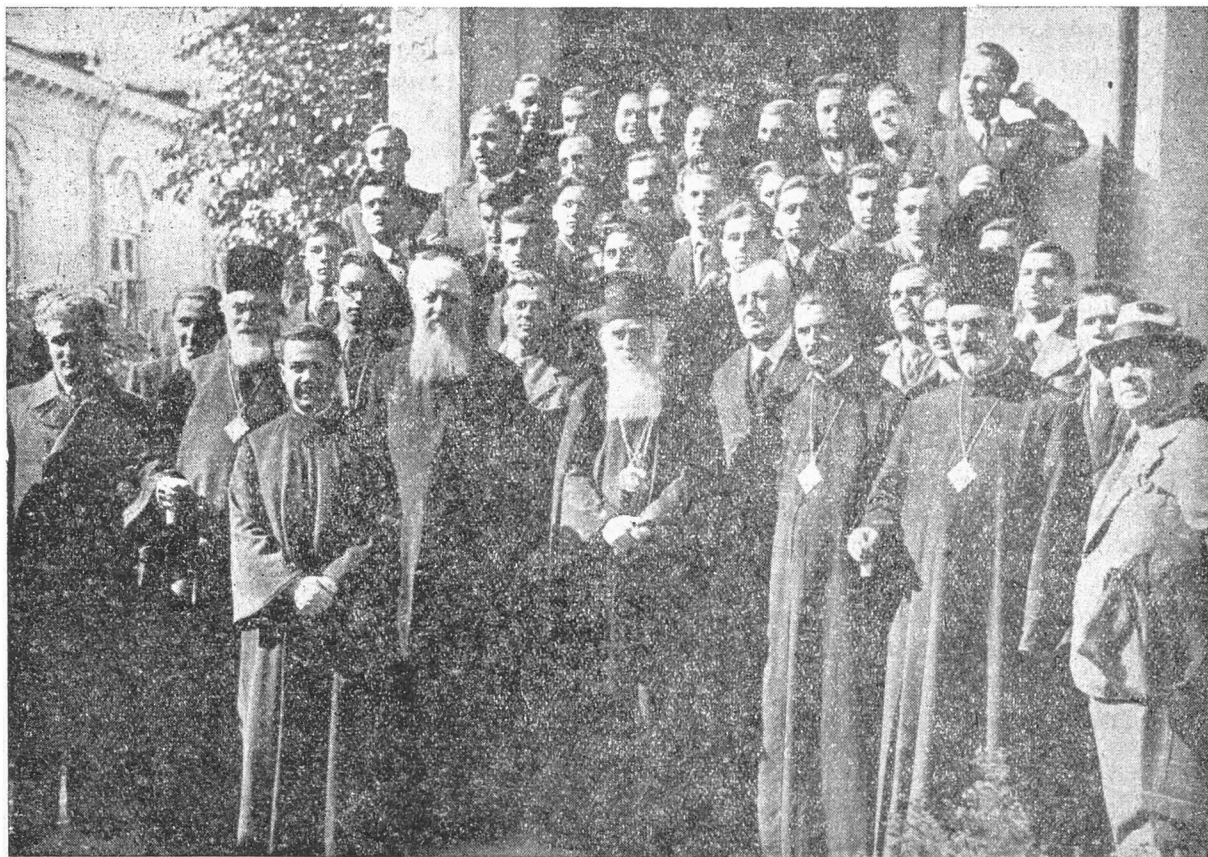
I. P. S. PATRIARH MIRON CRISTEA , înconjurat de corpul profesoral și studenții Academiei de muzică religioasă din Capitală, după rugăciunea de deschiderea anului școlar.

Scopul urmărit de căminul cultural românesc de pretutindeni, este cum spune le-