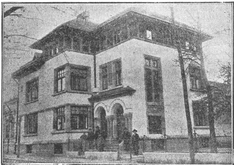
Casa parohială a Bisericii Sfinții Voevozi din București.