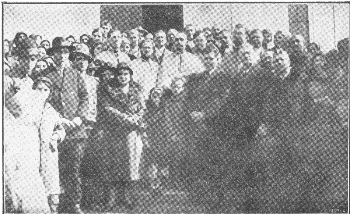
Botezul celor 2 copii adventiști din comuna Odaia-Teleorman

După Sf. Liturghie s’a săvârșit parastas pentru