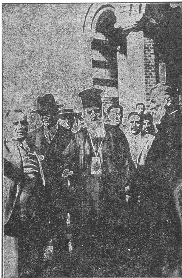
I. P. Sf. Patriarh Miron cu d-l Alex. Lapedatu, ministru al Cultelor după inspecția întregii clădiri, unde lucrările erau în curs de doi ani, 1927.