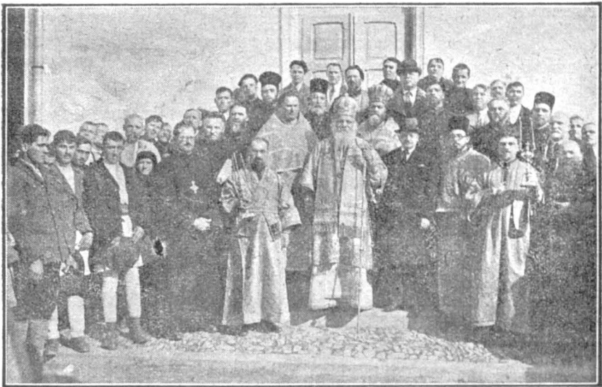
I. P. S. Patriarh Nicodim — la redeschiderea bisericii din Oglinzi — Răucești Neamț, când era stareț la Mănăstirea Neamțu.

Mai întâi de toate calendarul nu s'a schimbat, ci a fost îndreptat. Și apoi ce-are a-face calendarul cu legea! ? Legea noastră ați văzut unde stă: pe Sf. Masă în Sf. Altar. Este frumos împodobită, îmbrăcată în aur, sau în argint și este purtată cu cinste prin biserică, iar slujitorul care o poartă, înălțându-o în Ușile împărătești, zice cu glas mare: Înțelepciunea , căci acolo