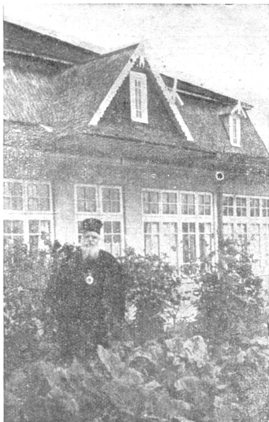
I. P. S. Patriarh Nicodim — surzător — între tufele de trandafiri din fața chiliei sale dela Mănăstirea Neamțu.