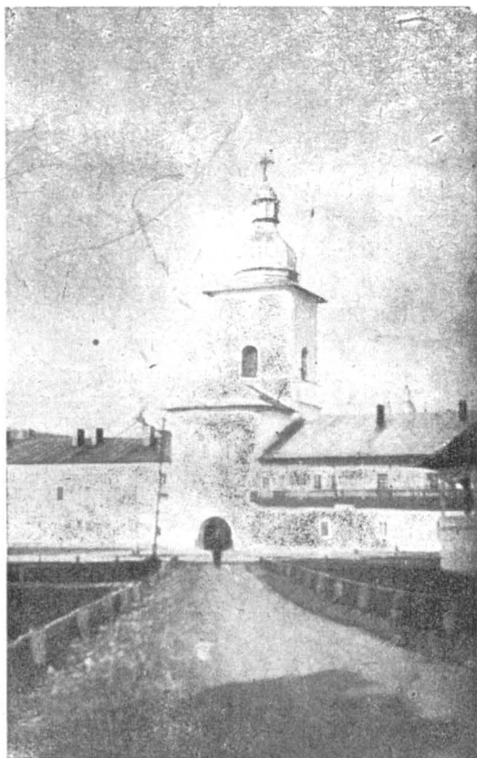
Șosea în interiorul Mânăstirei Neamțu

Acum 10 ani, un domn, al cărui nume îmi scapă din minte, printr'un ziar din București, plângea cu lacrimi mari de crocodil, că Sf. Mănăstire Neamțu intră în posesia averei sale, rășluită din vremuri și că va fi rău administrată. Cu drept cuvânt plângea acel domn și alții ca el, pentru că brazii din jurul Sf. Mânăstiri produceau spre d-lor multă evlavie..., chereștea, brânză, unt, vânat, și a.