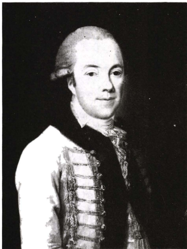
Anonim, Portretul Contelui Althan (ulei pânză)

În colecția muzeului nostru întâlnim și un portret, ulei pe pânză, reprezentând un bărbat tânăr, întors în profil de 3/4 spre dreapta,