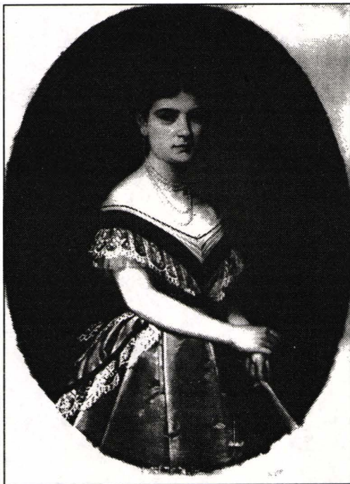
Gh. Tattarescu Portret de femeie

“Portretul de femeie” este semnat în dreapta jos cu roșu, “Tattarescu” și datat 1870, iar “Portretul de bărbat” este semnat în stânga jos, cu roșu, Tattarescu și datat 1870.