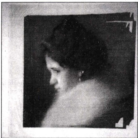
Fig. 3, 4 Dublarea suportului cu hârtie japoneză