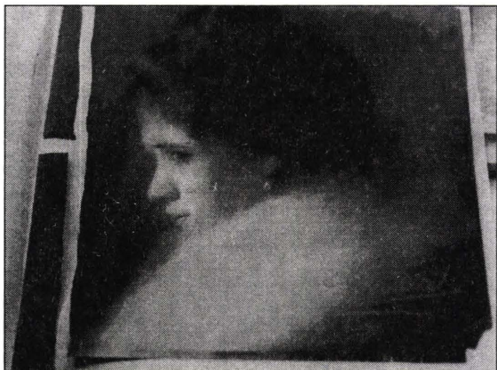
Fig. 1. Lucrarea înainte de restaurare (față)