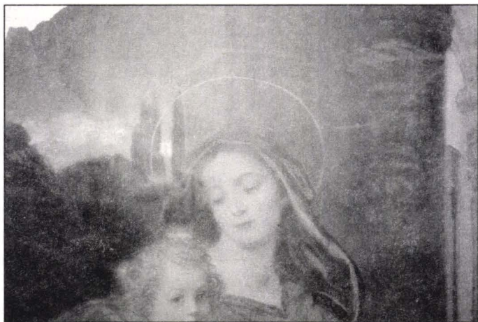
Madona cu pruncul, după restaurare, detaliu

Astfel "icoana" - și-a reprimit funcția de "imagine" - care poate fi valorificată expozițional.