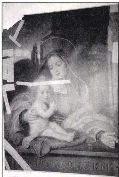
Faze de lucru