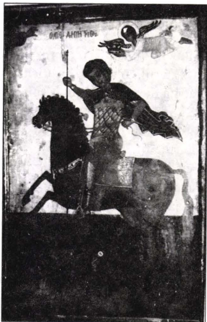
Icoană de hram Biserica "Sf. M. Mucenic Dimitrie", Vlădeni