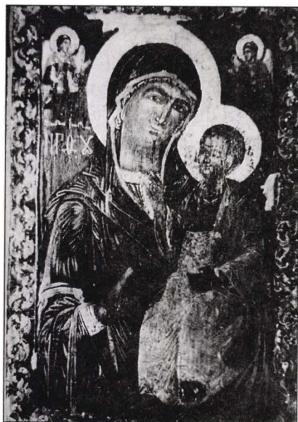
Icoană împărătească "Maica Domnului cu Pruncul" Biserica Sf. Voievozi, Zlotica