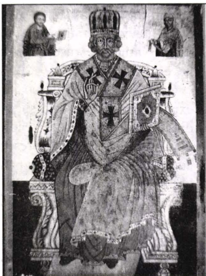
Icoană împărătească "Sf. Ierarh Nicolae" Biserica Sf. Nicolae, Ciohorăni