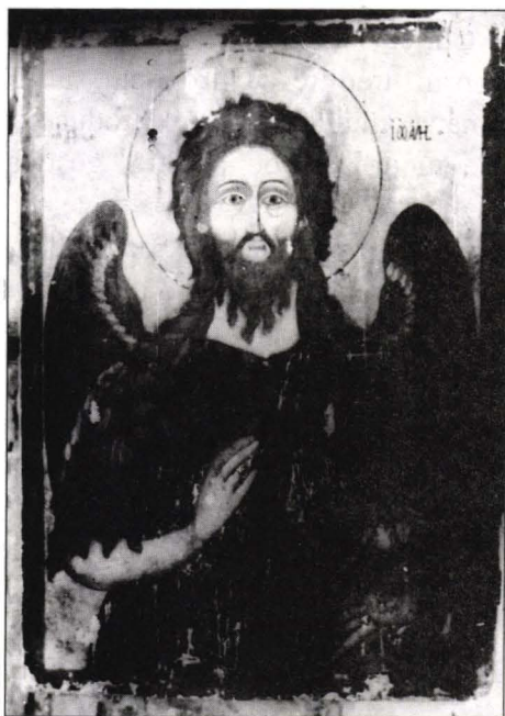
Zugravul Ion, Icoana "Sf. Ioan Botezătorul" Biserica "Duminica tuturor Sfinților", Țibănești