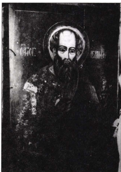
Icoană de hram Biserica "Sf. Ioan Teologul" satul Mănăstirea, comuna Dagâța