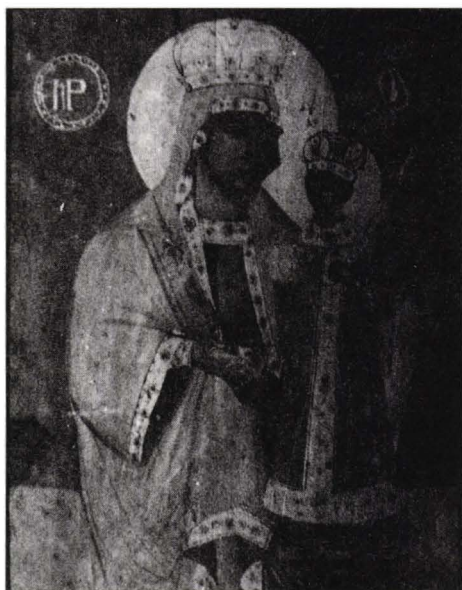
Zugravul Macarie Icoană împărătească "Maica Domnului cu Pruncul" Biserica Nașterea Maicii Domnului, Tomești