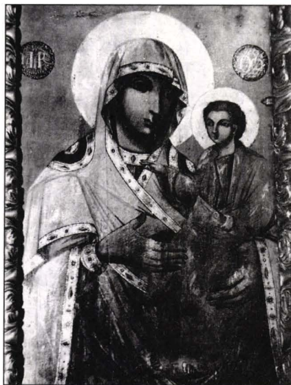
Icoană împărătească "Maica Domnului cu Pruncul" Biserica Dovidenia, Iași