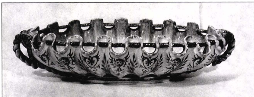
Jardinieră Ginori, gen Torelli, décor “a raffaellesche”, execuție XIX 4/4, în stil sec. XVI; Forma godronată amintind de cochilie, finețea desenului și ajurul bordurii trimit către unele modele consacrate ale porțelanului sec. al XVIII-lea.

Faianța italiană trece în a doua jumătate a sec. al XVIII-lea și prima jumătate a sec. al XIX-lea, la imitarea tehnicii și motivelor decorative ale porțelanului german, cu scene galante sau de gen, peisaje inspirate după pictura de șevalet, ori așa numitele “flori naturale”, ilustrate prin piesele de Torelli,