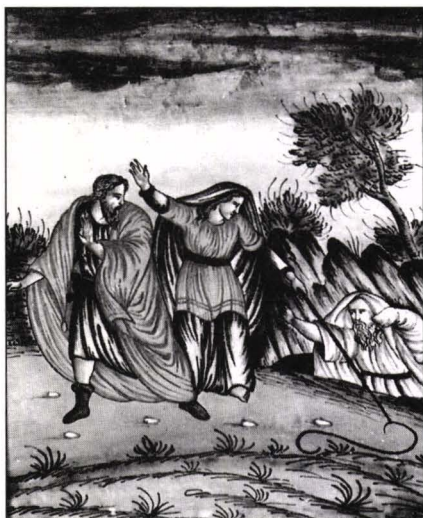
Placă decorativă Issel, gen Savona – decor scenă biblică “Moise transformând toiagul în șarpe”.

Marile personalități ale culturii universale constituiau modele pentru societatea în formare a sfârșitului de secol, astfel că vom întâlni frecvent comenzi de piese cu portrete ale lui: Dante, Petrarca, Boccaccio, Donatello, Machiavelli, Raffael etc. ( foto portret Machiavelli ).